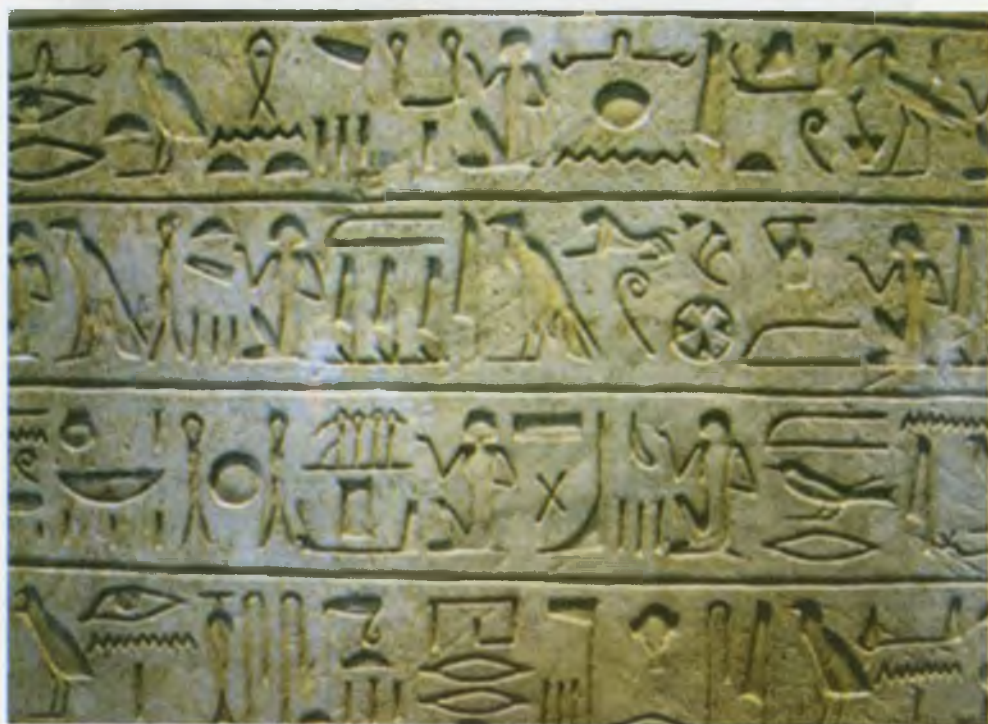
Қадимги Миср ёзуви.

Пиктограммлар – ҳарфларнинг келиб чиқиши аниқ эмас, балки мисрликларнинг бир бўғинли фоеограммларидан келиб чиққан бўлиши мумкин. Аммо уларни протоханааней ёзувига мослаштириш жараёнида тузилишининг соддалашуви юз берган. Ёзув белгиларини янада соддалаштириш жараёни финикия алифбосига – 22 та ундош ҳарфлардан иборат оддий тизимнинг яратилишига олиб келган.