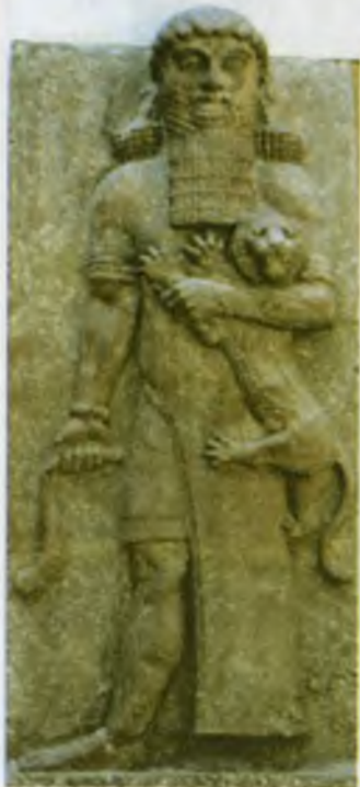
Гилгамиш. Мил. авв. VIII аср. Саргон II саройининг давозасига ишланган нақш.

арбобларни шарафлашга бағишланган 1 Адабиётнинг бу соҳасида марказий ўринни жасур Гилгамиш ҳақидаги ривоят эгаллайди. Унинг тарихи улкан муаммони – ҳар бир инсонни муқаррар кутаётган, ўзининг бутун қудрати билан, ҳатто Гилгамиш ҳам сақлана олмайдиган фожиали тақдир – ўлим муаммосини кўтаради. Қаҳрамон шахси амалда унинг мунгли қисмати билан тўсиб қўйилган, кўплаб жасоратлар битта мақсад – асрлар оша ҳеч бўлмаса номи сақланиб қолиши учун амалга оширилади.