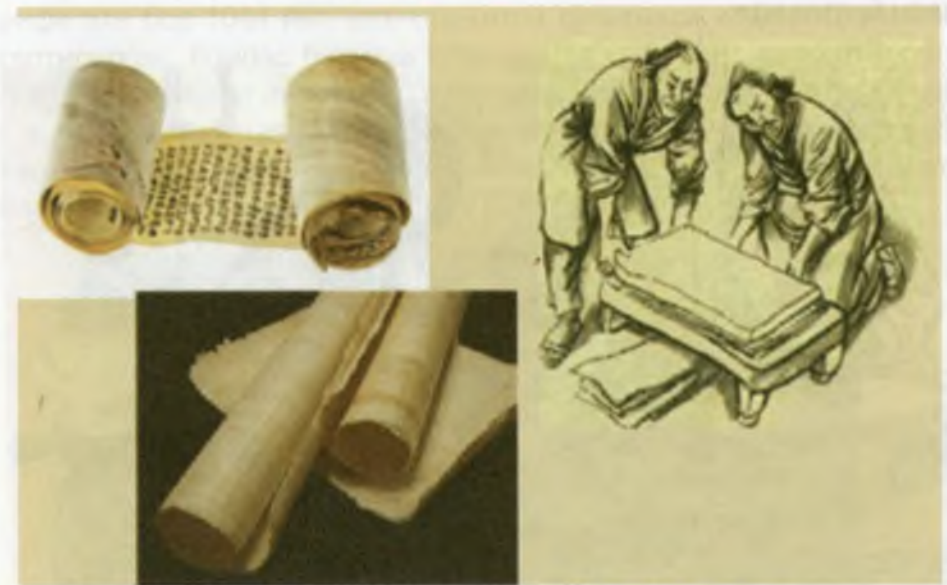
Хитой қоғозлари ва уларни тайёрлаш жараёни.

Қадимги Хитойнинг биринчи буюк кашфиёти қоғоз бўлди. Хитойнинг Шарқий хан сулоласи солномаларига биноан қоғозни Хан сулоласи саройидаги евнух (бичилган қул)лардан Цай Лунь 105 йили кашф этган.