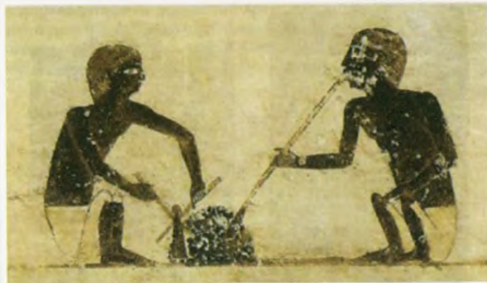
Қадимги Мисрда шиша эритиш жараёни.

Мил. авв. I асрда суриялик усталар қувурчалар орқали дамлаб, шиша буюмлар ясаш усулини – шишадамгарликни ўзлаштирди. Бу усулдан ҳозиргача шишадамгар усталар жуда ноёб шиша буюмларни ясашда фойдаланиб келадилар. Шишадамгарлик фақат шиша буюмлар ясаш усулининг эмас, шиша таркибининг ҳам ўзгаришига олиб келди. Натижада замонавий ойна ясаш технологияси пайдо бўлди.