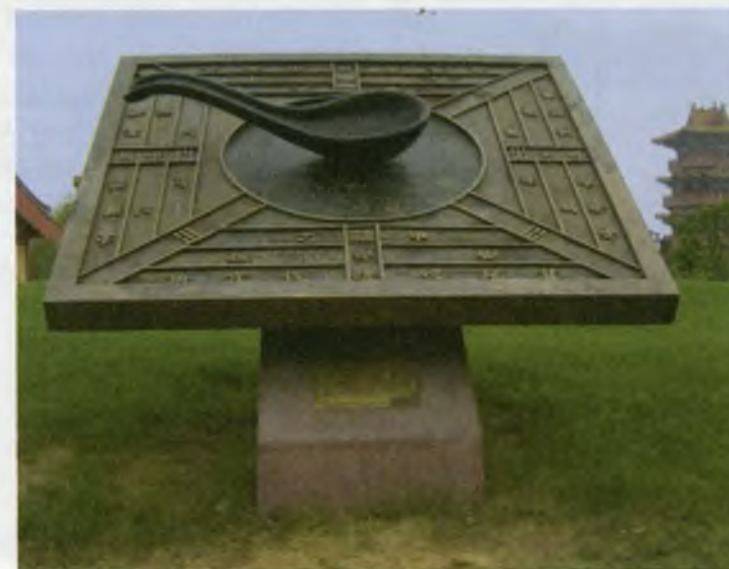
Хитойда қадимги компасга ўрнатилган ёдгорлик.

Дунё томонларини кўрсатувчи магнит компаснинг батафсил таърифи илк бор 1044 йил қадимги хитой қўлёзмаси «Уцзин Цзуньяо»да келтирилган. Компас балиқча кўринишида қўйилган, магнитлашган ва қиздирилган пўлат ёки темир бўлак-чаларидаги қолдиқ кучланиш принципи асосида ишлаган. Пўлат балиқчалар сув тўлдирилган косага жойлаштирилганда индукция ва қолдиқ магнитлашиш натижасида магнит кучлари пайдо бўлади.