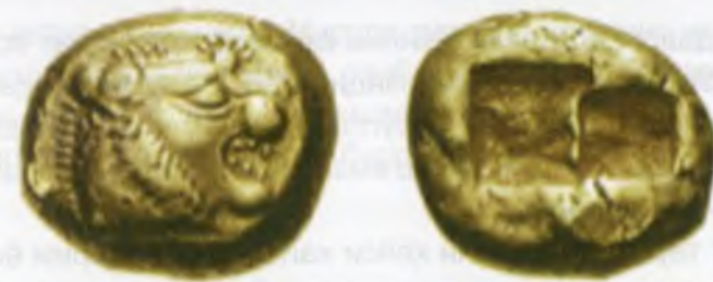
Зарб қилинган қадимги пул – сикель.

дан иборат қумуш пулга сотиб олиш мумкин бўлган. Дастлабки шундай пуллар металл қумушлар шаклида бўлиб, улар зарб қилинмаганлиги сабабли ҳар бир савдо жараёнида бу пулларнинг қийматини тарозида ўлчаш, таркибидаги мис ва қумуш миқдорини аниқлаш лозим бўлган.