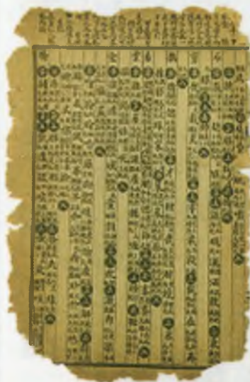
1160 йили чиқарилган Хитой қоғоз пули – Хуэйцзи.

Қадимги Хитой олимларининг кўплаб ихтиро ва кашфиётлари инсоният томонидан унутилиб, фақат янги даврда уларга қайтилди. Қоғоз пуллар ҳам XVI–XVII асрларда Европада янгидан кашф этилди ва шу даврдан бошлаб бутун дунёга кенг тарқалди.