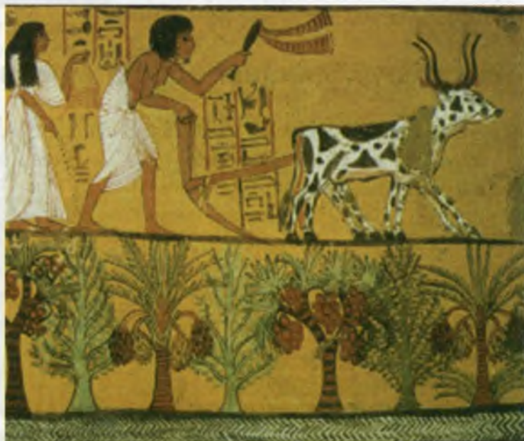
Қадимги Мисрда ерга ишлов бериш жараёни.

Инсоният тарихида омовни қайси халқ – шумерларми ёки мисрликлар биринчи ихтиро қилганлиги ҳақидаги баҳс тарихчилар орасида ҳамон давом этмоқда. Омов – бу ерни шудгор қилиш учун мўлжалланган асбобнинг умумлаштирилган номи. Турли цивилизациялар ва халқларда унинг ҳар хил кўринишлари бўлган. Кўпчилик олимларнинг тахмин қилишича, омов унга ўхшаш, инсоннинг қўл кучи билан ерга ишлов беришга мўлжалланган меҳнат қуролини такомиллаштириш натижасида пайдо бўлган. Аммо самарадорлиги анча шубҳали, чунки у енгил бўлганлиги учун фақат ернинг устки қисмига ишлов берган, холос. Мисрнинг қуёшли кунларида бу асбоб билан ерга ишлов бериш мураккаб иш бўлган.