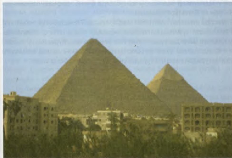
Гизадаги эҳромлар – Қадимги Мисрнинг энг буюк меъморий ёдгорликлари, улар орасида Дунёнинг етти мўжизасидан бири бўлган Хуфу (Хеопс) эҳроми ҳам бор.

ва улар бир-бирининг шаклланишига таъсир кўрсатган бўлиши мумкин. Аммо бу икки меъморий типларнинг ривожланиш жараёни турлича. Агар Месопотамия зиккурати минг йиллар давомида ўзгармаган, фақат шакли мукамаллашиб борган бўлса, зинали эҳром IV сулола даврида кескин ўзгариб, янги меъморий ечим касб этади ва у бошқа ўзгармасдан қолади: бу квадрат асосга қурилган, деворлари силлиқ тенг томонли учбурчаклардан ташкил топган ҳақиқий эҳром. Биз мисол тариқасида келтиришимиз мумкин бўлган бундай эҳромларнинг энг машхури – бу Хуфу (Қадимги мисрликлар тилида Хуф-и-Хнам, юнонларда эса Хеопс дейилган) эҳроми: асосининг ҳар бир томони 230 метрни, баландлиги эса 146 метрни ташкил қилади. Унга ҳар бири ўртача 2,5 тонна келадиган 2 300 000 дона блок сарфланган. Геродот ёзиб қолдирган афсонага кўра, эҳром қурилишида 100 минг киши 20 йил банд бўлган. Эҳромдаги даҳмага мураккаб даҳлизлар тизими орқали борилади. Одатда, эҳром ўз ичига ибодатхона, пастга, дарё водийсига элтувчи усти ёпиқ айвонни ҳам олувчи меъморий мажмуа таркибига киради.