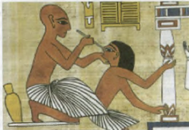
Қадимги Миср тиббиёти.

Қадимги Мисрда юқумли касалликларни даволаш учун замонавий кимёвий ампициллиннинг прототипи кашф қилинган. Бу кашфиёт жуда оддий йўл билан амалга оширилган: ноннинг моғорлаб кетган жойи яраланган жойга босилган ва касал киши ўз-ўзидан соғайиб кетган. Ампициллиннинг таркиби олимлар томонидан фақат XX асрдагина кашф қилинди.