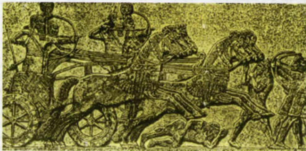
Оссуриянинг оғир жанг араваси.

Дастлаб жанг араваларига от эмас, эшаклар қўшилган, чунки замонавий кўринишдаги отлар мил. авв. II минг йилликда пайдо бўлди. Дастлабки отлар қўшилган жанг аравалари Қадимги Миср ва Оссурия қўшинида пайдо бўлган. Бу отларнинг бўйи 160 см, оғирлиги эса 500 кг гача бўлган.