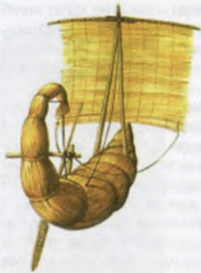
Папирус боғламларидан ясалган дастлабки елканли кеманинг кўриниши.

ди. Бу даврда кемалар мисрликлар учун ҳаётий заруратга айланган.