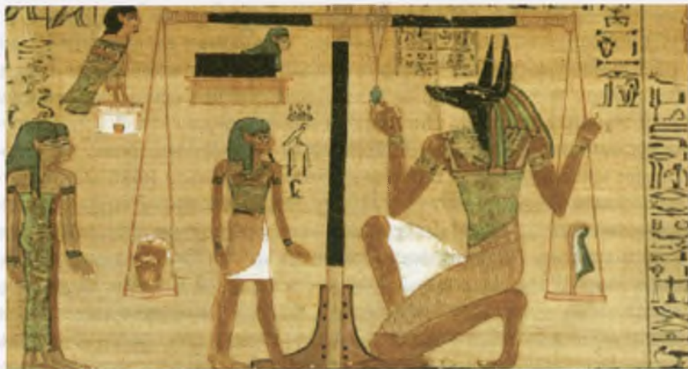
Папирусга ёзилган «Мархумлар китоби». Қадимги Миср.