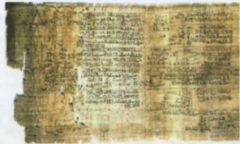
Қадимги Миср папируси.

Ёзувни шумерликлар кашф этганлиги ҳақида юқорида айтилди. Мисрликлар тарихий солномаларни ёзиш учун материал – папирусни кашф этганлар. Папирус Нил дарёси соҳилларида кўплаб ўсган нилу-фар ўсимлигининг поясидан тайёрланган. Папирус тайёрлаш технологиясини мисрликлар ўта мукамал билишган, баъзи ноёб маълумотларни ўзида сақлаган папируслар бир неча минг йил ўтса ҳам ҳамон яхши сақланиб қолган. Улардаги матн осон ўқилади, расмларни ҳам тез англаш мумкин. Папирусларда сақланиб қолган бу маълумотлар қадимги Яқин Шарқ цивилизацияларининг маданий ўтмиши ҳақида тасаввур ҳосил қилиш имконини беради. Бу маълумотлар энциклопедик характерга эга бўлиб, уларда қадимги хариталар ҳам сақланиб қолган. Бу хариталар қадимги мисрликларнинг атроф олам ҳақидаги тасаввурлари ҳақида қимматли маълумот беради. Хариталардан бирида фиръавн армиясининг Африка қитъаси бўйлаб ҳаракат йўналиши кўрсатилган.