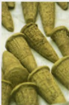
Қадимги Шумер илк пуллари шундай кўринишда бўлган.

Археологлар томонидан олиб борилган қазилар ишлари давомида Месопотамия ҳудудида топилган ашёлар бундан 5000 йил илгари бу ерда натурал алмашув мавжуд бўлганлигидан далолат беради. Қизиғи шундаки, инсоният тарихидаги илк ёзма манбалар адабиёт намуналари бўлмасдан, оддий ҳисоб-китоблар, солиқ йиғими ҳақидаги маълумотлардан иборат. Сопол тахталарда сақланиб қолган мил. авв. 2400 йилга оид ёзувларда давлат амалдорларига солиқларни ғалла, қўй ва қўзи, ҳатто янги овланган балиқ билан олишга ҳам рухсат берилган. Аммо шу даврда пул ҳақида ҳам ёзувлар пайдо бўлади.