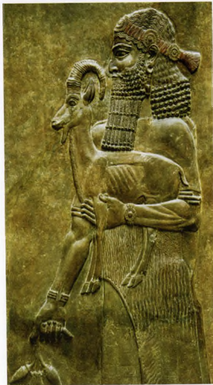
Ўтўнбада Тўти Ўтўнбада Тўти

Рус тилидан Маҳкам Маҳмуд, Зайниддин Баҳриддин таржималари.