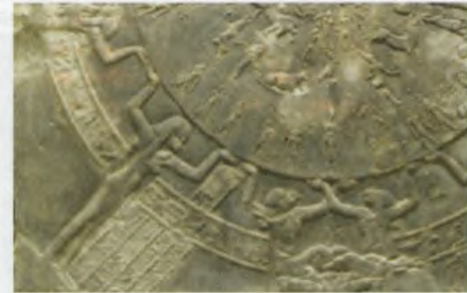
Парижнинг Лувр музейида сақланаётган бурж доираси.

Олимларнинг айтишича, дастлабки математик тадқиқотлар Қадимги Мисрда амалга оширилган. Мисрликлар ҳисоблашнинг ўнлик тизимини кашф этганлар, улар бўлиш ва кўпайтириш амалларини ҳам билишган. Аслида, математик ҳисоб-китобларсиз қадимги мисрликлар минг йиллар давомида ўз маҳобати билан инсониятни лол қилиб келаётган машҳур эҳромларни қуриши мумкин эмасди. Қадимги ёзувларнинг далолат беришича, уларга π (пи) сонининг хоссалари ҳам маълум бўлган, Хуфу (Хеопс) эҳромини ва бошқа фиръавнларнинг мақбараларини қуришда π сонининг хоссаси асос қилиб олинган. Мисрликлар ҳажм ва майдонни ўлчаш усулларини ҳам билишган.