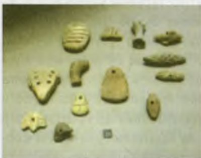
Қадимги Шумер танга (жетон)лари.

воситаси сифатида қўлланилмаган. Месопотамияда бундай тангалар тизим қилиб ишга боғлаб ҳам юрилган. Қадимги сопол тахталардаги ёзувларда улар ҳақида шундай дейилган: «Месопотамия шаҳарларида