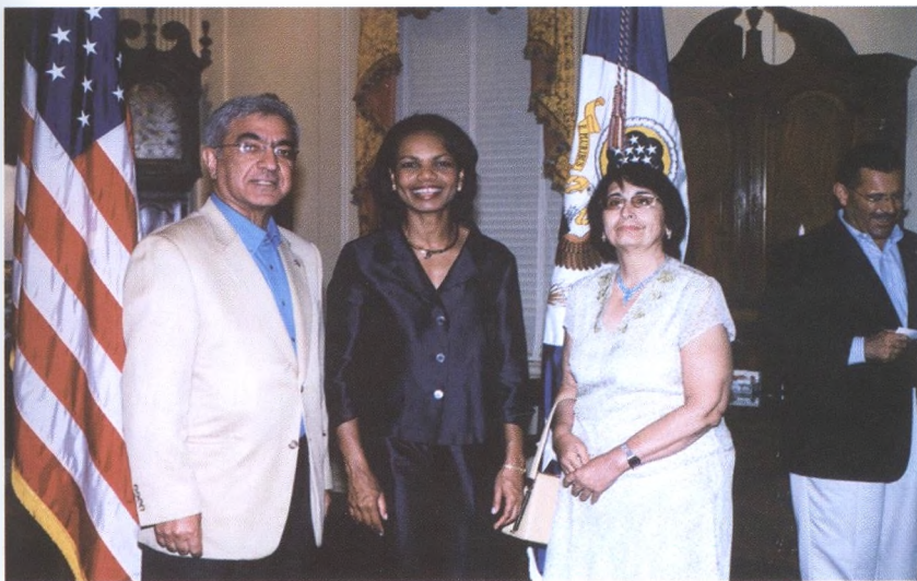
AQSH Davlat kotibi Kondoliza Rays tomonidan uyushtirilgan Mustaqillik kuniga bag'ishlangan qabul marosimida Ra'no xonim bilan (4-iyul 2006-yil).