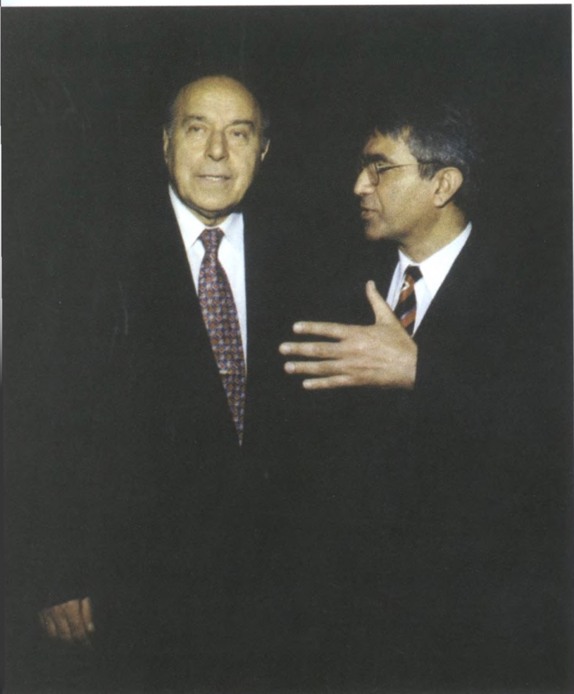
Prezident Haydar Aliyev bilan AQSH Kongressidagi tashrifi davomida. (1997-yil)