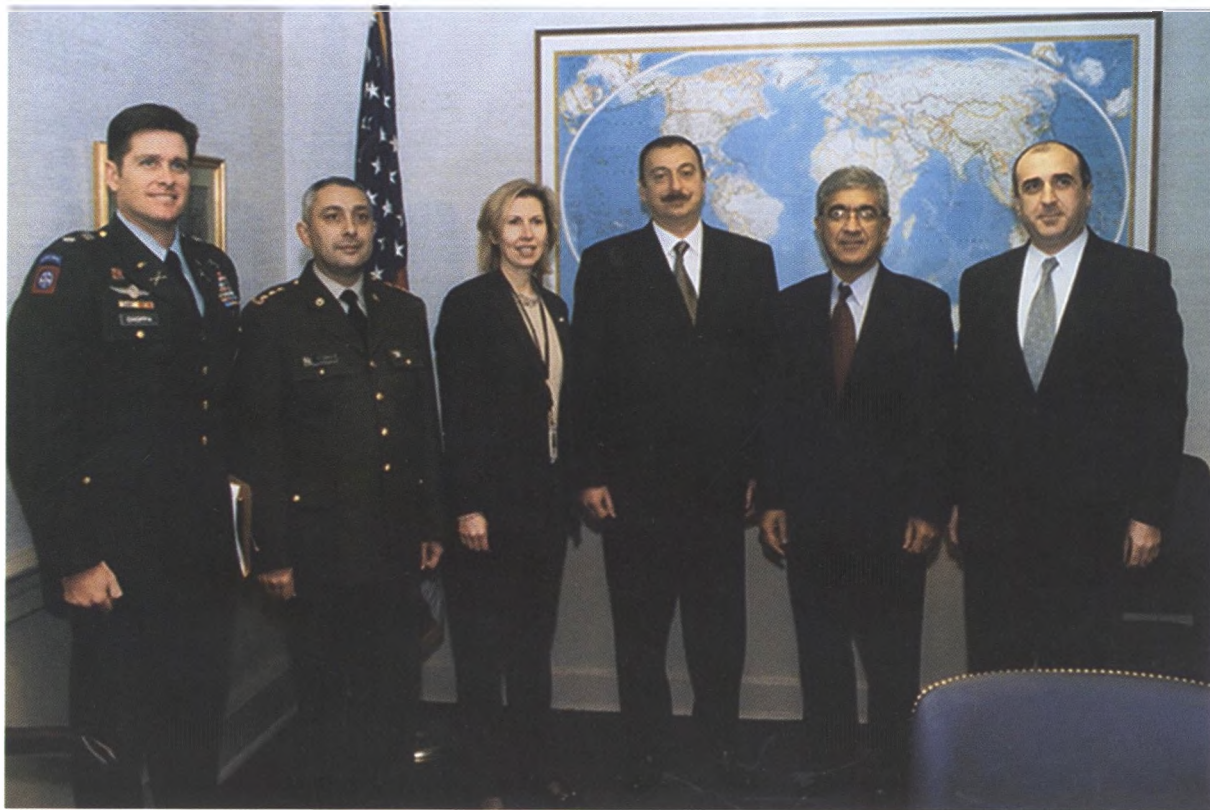
Prezident Ilhom Aliyev Pentagon yig'ilishida.