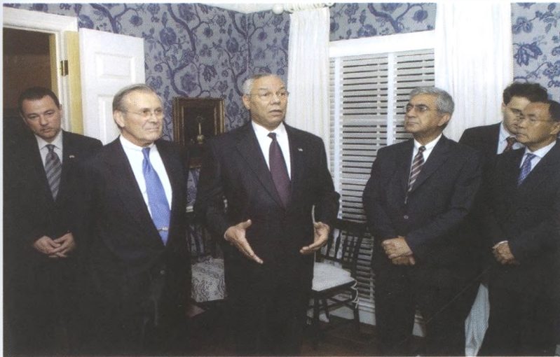
AQSH Mudofaa vaziri Donald Ramsfeldomning qabulida Davlat kotibi Kollin Pauell janoblarining nutqi (2004-yil).