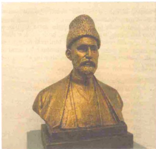
"Sayid Azim Shirvoni" Haykaltarosh: Nizomiy Karimov

Sasi va so'zi abadiy hayot bo'lgan insonlarning buyuk kuchi ham doim millatlar, mamlakatlar, yuraklar, fikrlar orasida aynan mana shunday mo'tabar, suyuqli ko'prik bo'lishi lozim!