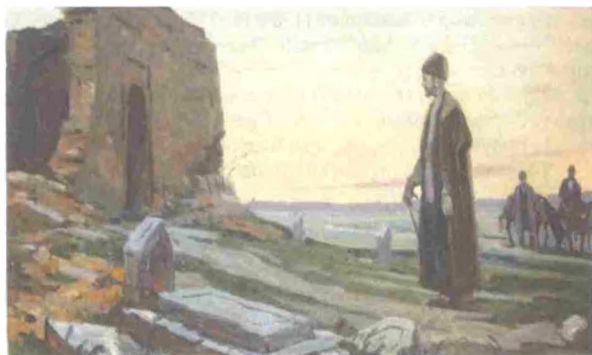
"Sayid Azim Shirvoniy Nizomiy Ganjaviyning qabri ustida" Rassom: Tug'rul Sodiqzoda

Agar shunday bo'lmaganida, har birining ichida bir vulqon qaynagan satiralarni yoza olmasdi.