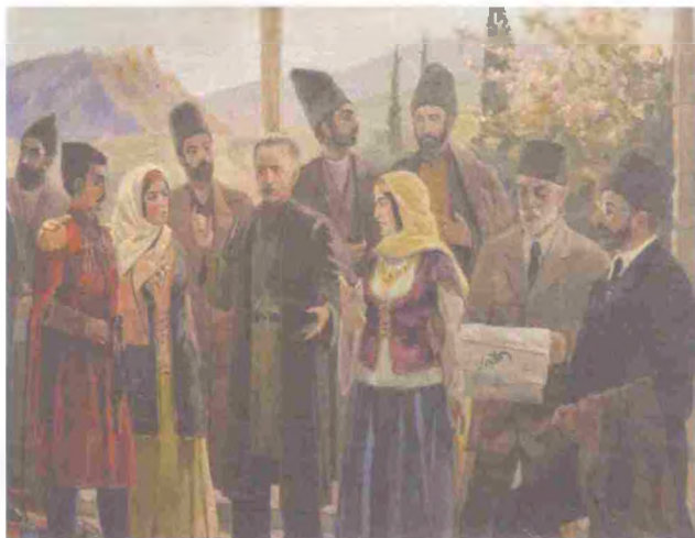
"Uluqloring uchrashuvi" Sayid Azim Shirvoniy ruhdoshlari orasida

Biz esa unga mana shunday dars berdik. Boshqalar bergan darsdan saboq olmadik, hech bo'lmasa o'zimiz bergan darsdan xulosa chiqaraylik. Axir bo'lib o'tgan tarixlar insonlarning o'tinishdan ibrat olish fursati hisoblanadi.