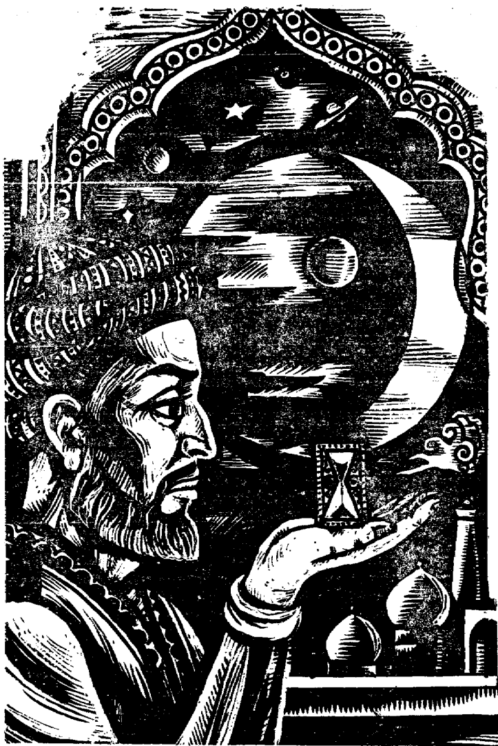
Абу Али ибн Сино