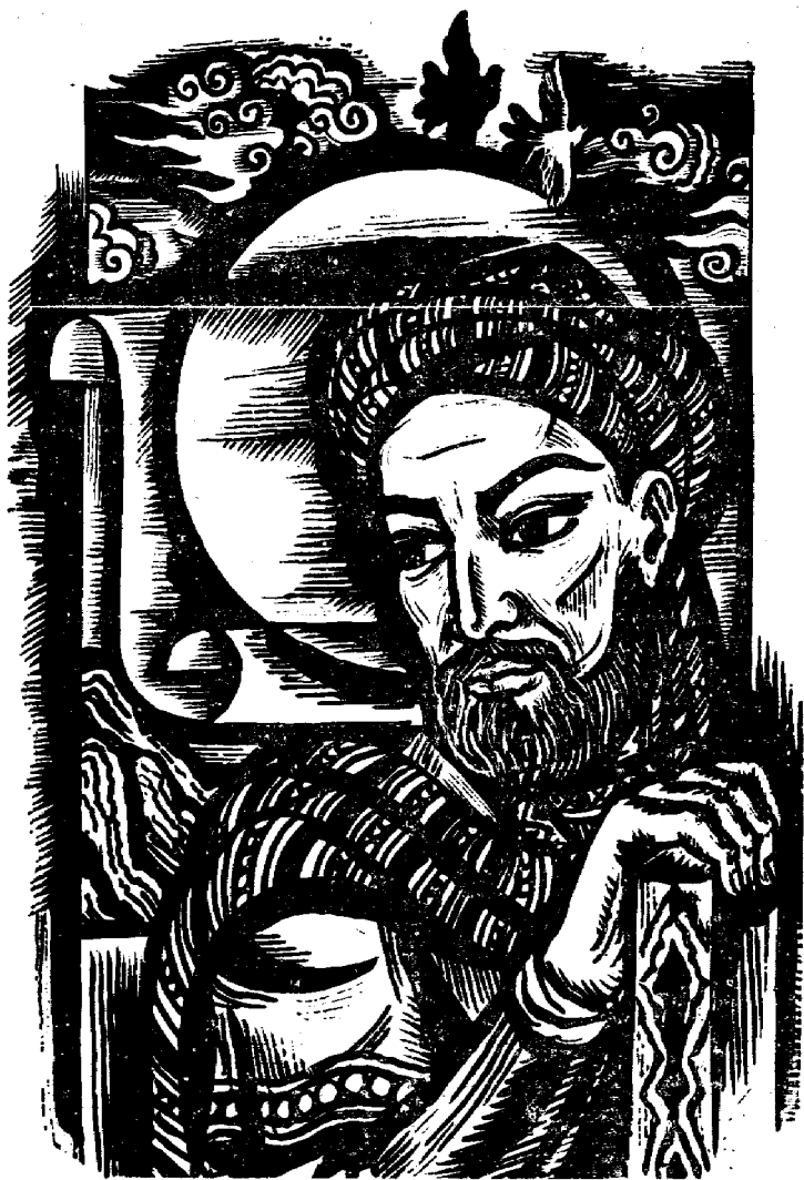
Абу Райҳон Беруний