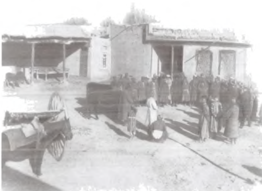
Бой хўжалиги чорва моллари ва ишчи ҳайвонларини мусодара қилиш. Фарғона, 1925 йил.

1925—1929 йиллар ислоҳоти оммавий жамоалаштириш (коллективлаштириш) йилларида амалга оширилган «қулоқлаштириш» сиёсатини маълум даражада бошлаб берган эди. Жамоалаштиришни ўтказиш жараёнида, худди «буюк бурилиш» даврида бўлгани каби, шахсий ўч олиш, зўравонлик кўрсатиш каби қўпдан-қўп ҳолларга йўл қўйилган эди. Бунда совет ҳокимиятининг шу йиллардаги барча органлари учун хос бўлган «инқилобий-бюрократик» тафаккур мантиқига мувофиқ миқдорий кўрсаткичлар ортидан қувиш, «экспроприация» қилина-