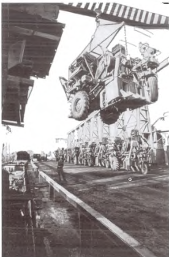
«Тошқишлоқмаш» заводида пахта терим машиналари ишлаб чиқариш. 1981 йил.

Машинасослик корхоналаридан кўпларининг иши бевосита пахтачилик билан боғлиқ эди. Бу корхоналар асосан пахта етиштириш, териб олиш ва бирламчи ишлов бериш жараёнларини бажарадиган механизмлар ишлаб чиқарар эди, холос. Республиканинг тўқимачилик санواتи эса, асосан ип-йигирув, қисман тўкув билан шуғулланар, бунинг учун эса Ўзбекистонда етиштириладиган пахта толасининг арзимас қисми ишлатилар эди. Пахтага ундан кейинги ишлов бериб, пировард маҳсулотга айлантириш ҳуқуқи метрополия тўқимачилик санواتи корхоналарига берилган эди. Шунинг