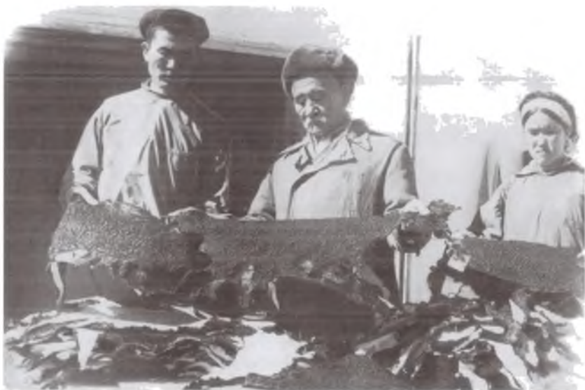
Бухоро чорвадорлари Марказга юбориш учун қоракўл териларини сараламоқдалар. Конимех тумани, 1952 йил.

50-йилларнинг бошларида жамоат чорва моллари сони урушдан олдинги даражага ҳали етмаган эди. 1953 йилда республикада барча турдаги хўжаликларда 1321 минг бош қорамол мавжуд бўлиб, 1940 йилдагига нисбатан 372,1 минг бош кам эди. Бунинг натижасида гўшт маҳсулоти сезиларли равишда пасайиб борди, айниқса, қорамоллардан олинадиган гўшт камайиб кетди. Агар 1945 йилда ялпи гўшт етиштириш 73,5 минг т. бўлган бўлса, 50-йилларнинг бошларига келиб фақат 57 минг т. гўшт етиштирилди. Сут соғиб олиш 316,2 минг т.дан 300,2 минг т.га тушиб қолди 1 . Бундай хавфли тамойиллар бутун совет қишлоқ хўжалигини қамраб олган эди. Аграр соҳада юзага келган кескин танглик Сталин вафотидан кейин ҳокимиятни эгаллаган янги сиёсий раҳбариятни қишлоқдаги ижтимоий-иқтисодий сиёсатни жиддий равишда янгилашга мажбур қилди.