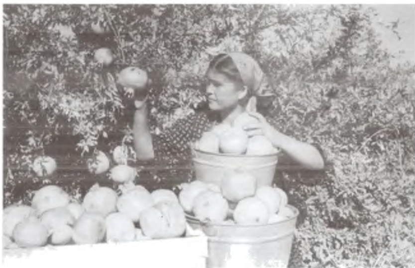
Ўзбеклар диёрида етиштирилган ширин-шакар мевалар. Тошкент тумани, 1978 йил.

сабаблари яна бир бор мулоҳаза қилиб кўрилди, унда махсус озиқ-овқат дастури қабул қилинди. Бироқ мазкур дастур туб ўзгаришларга олиб келмади. Аввалгидек бу дастур ҳам бошқаруving эскича тизими андозасида ишлаб чиқилган бўлиб, ўзида турғунлик даври изларини сақлаб қолган чала-ярим ҳолда эди. У қишлоқ хўжалигининг асосий ҳаракатлантирувчиси бўлган қишлоқ меҳнаткашлари манфаатларини, қишлоқдаги иқтисодий муносабатларни ўзгартиришни, хўжалик ва бошқарув механизминини тубдан қайта қуришни назарда тутмаган эди. Масалан, дастурдаги ишлаб чиқариш демократиясини чуқурлаштириш, хўжаликларнинг майда-чуйда ишларига аралашидан воз кечиш, қишлоқ оммасининг аграр ишлаб чиқаришни бошқаришда иштирок этиши зарурлиги ҳақидаги баландпарвоз сўзларга қарамасдан, реал ҳаётда ҳамма нарса аввалги маъмурий-буйруқ-бозлик йўлидан боришда давом этаверди. Натижада дастурда кутилган юксалиш ўрнига таназзул юз берди. Бу нарса айниқса аграр ишлаб чиқаришнинг самарадорлиги ва интенсивлиги соҳасидаги кўрсаткичларда яққол намоён бўлди. Масалан, меҳнат унумдорлиги республикада беш йиллик мобайнида 13% камайиб кетди. Қишлоқ хўжалик ялпи маҳсулоти ўртача йиллик ҳажмининг режа топшириқларига нисбатан 7% пастроқ бўлди. Қишлоқ хўжалик экинларининг ҳосилдорлиги сезиларли равишда пасайиб кетди. Жумладан, 1980 йилда пахта ҳосилдорлиги 29,7 ц/га ни ташкил этган бўлса, 1986 йилда фақат 24,3 ц/га тенг бўлди. Донли экинлар ҳосилдорлиги беш йилликда 21,4 ц/гадан 15,9