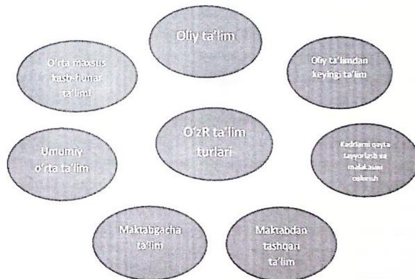
1-rasm. O'zbekiston Respublikasi ta'lim turlari

Uzluksiz ta'lim tizimining faoliyat olib borishi davlat ta'lim standartlari asosida, turli darajalardagi ta'lim dasturlarining izchilligi asosida ta'minlanadi. Kadrlar tayyorlash milliy modelining o'ziga xos xususiyati mustaqil ravishdagi to'qqiz yillik umumiy o'rta hamda uch yillik o'rta maxsus, kasb-hunar ta'limini joriy etishdan iboratdir. Bu esa umumiy ta'lim dasturlaridan o'rta maxsus, kasb-hunar ta'limi dasturlariga izchil o'tilishini ta'minlaydi. Umumiy ta'lim dasturlari: maktabgacha ta'lim, boshlang'ich ta'lim (I-IV sinflar), umumiy o'rta ta'lim (IV-IX sinflar), o'rta maxsus, kasb-hunar ta'limini qamrab oladi.