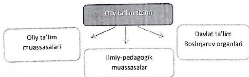
4-rasm. Oliy ta'lim tizimi tuzulishi

Oliy ta'lim ikki bosqichdan iborat: bakalavriyat va magistratura.