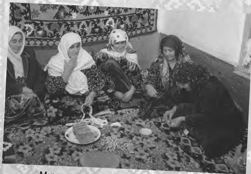
Мушкулкушод маросимига тайёргарлик