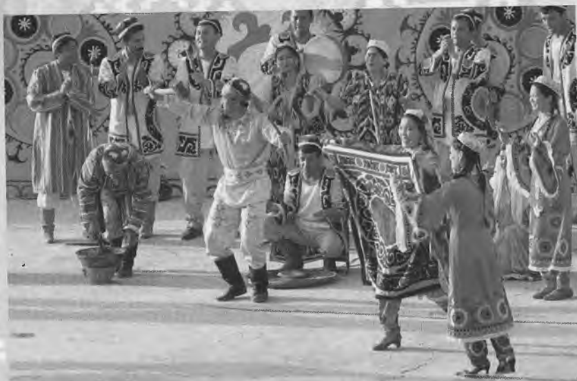
Халқ ансамблининг чиқиши