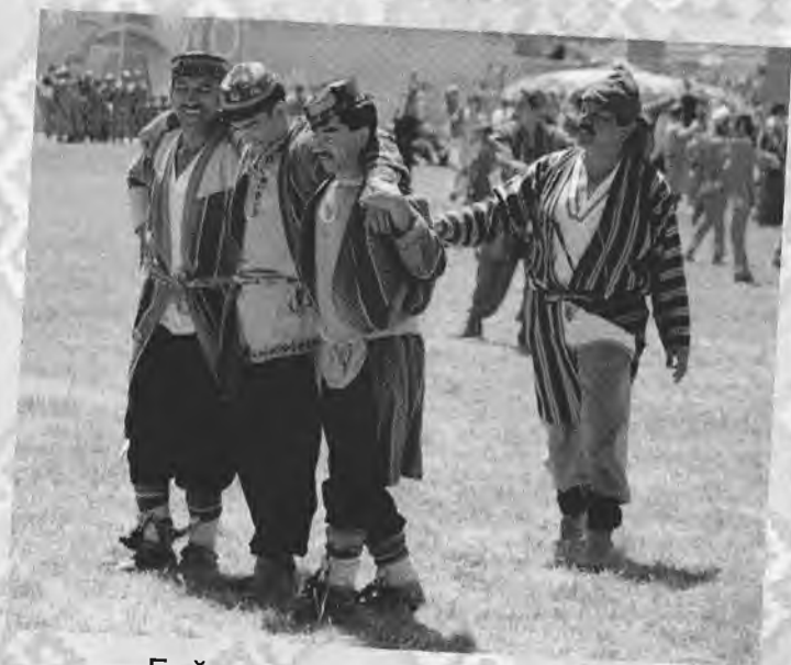
Бойсуннинг раққос йигитлари