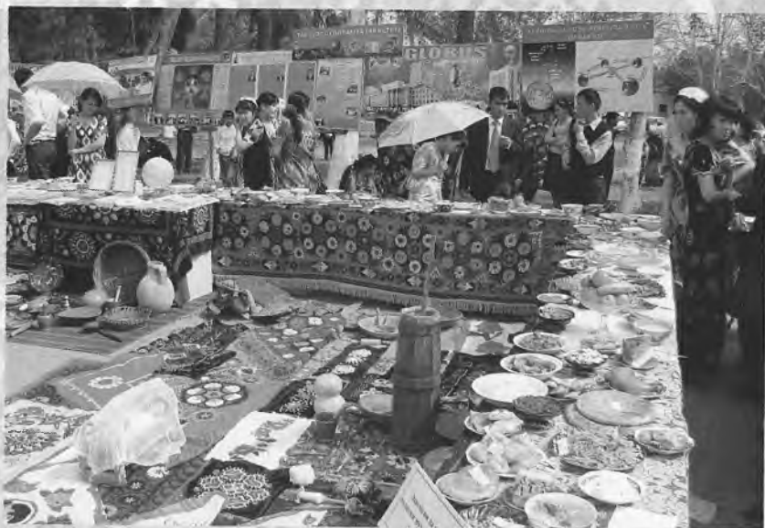
Навбатдаги тadbирга тайёргарлик