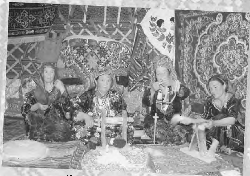
Кигиз тўқишга тайёргарлик