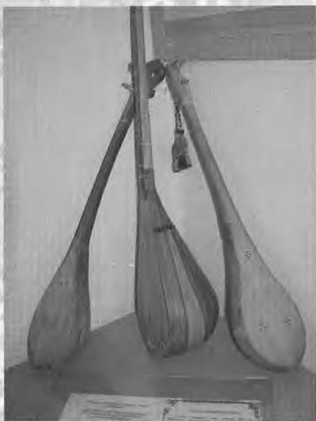
Халқ мусиқа асбоблари