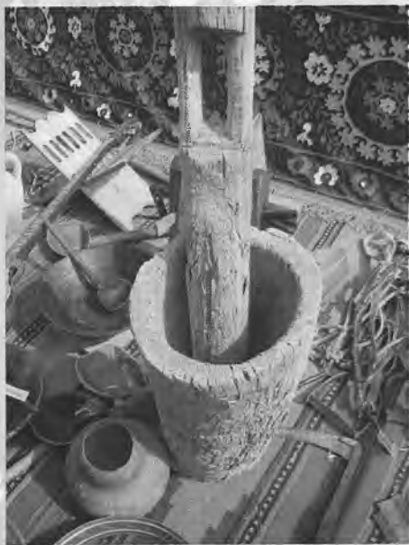
Сурхон воҳаси кувиси