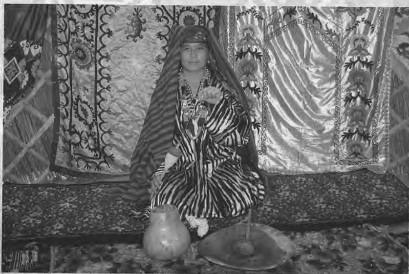
Урчуқ йигираётган аёл