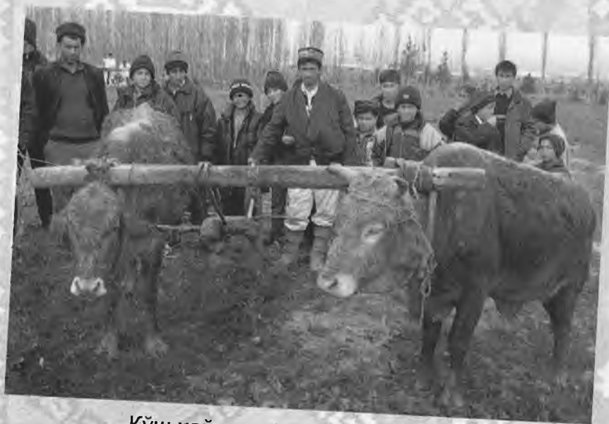
Қўш ҳайдаш маросимидан лавҳа