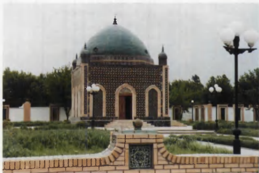
Farg'ona shahridagi Al-Farg'oniy maqbarasi.