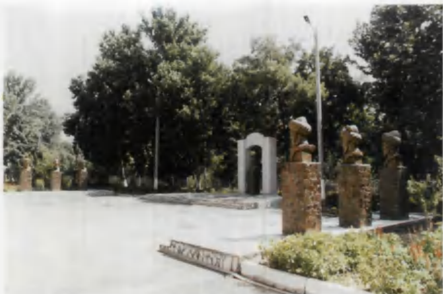
Toshkent Yuridik instituti qoshidagi akademik litsey bitiruvchilariga diplom topshirish maydoni.