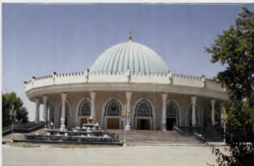
Toshkentdagi Temuriylar davlati tarixi muzeyi.