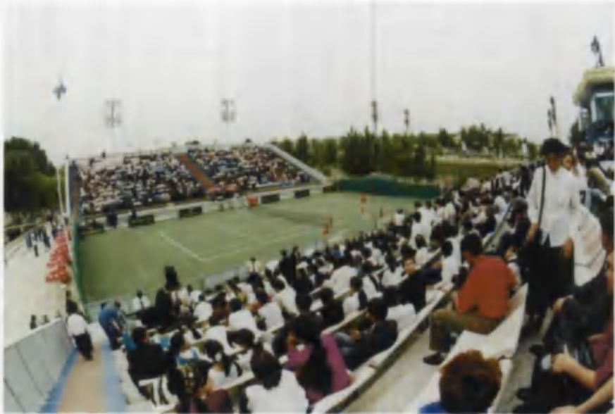
Namangan shahridagi tennis korti.