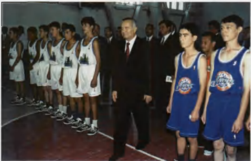
Prezident I. A. Karimov yosh sportchilar orasida.