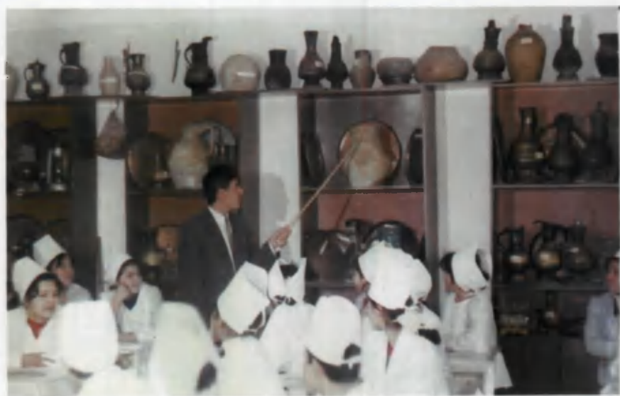
Milliy qadriyatlar muzeyi.