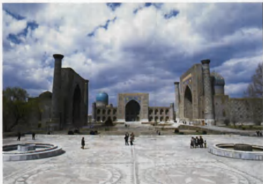
Samarqand. Registon maydonining umumiy ko'rinishi.