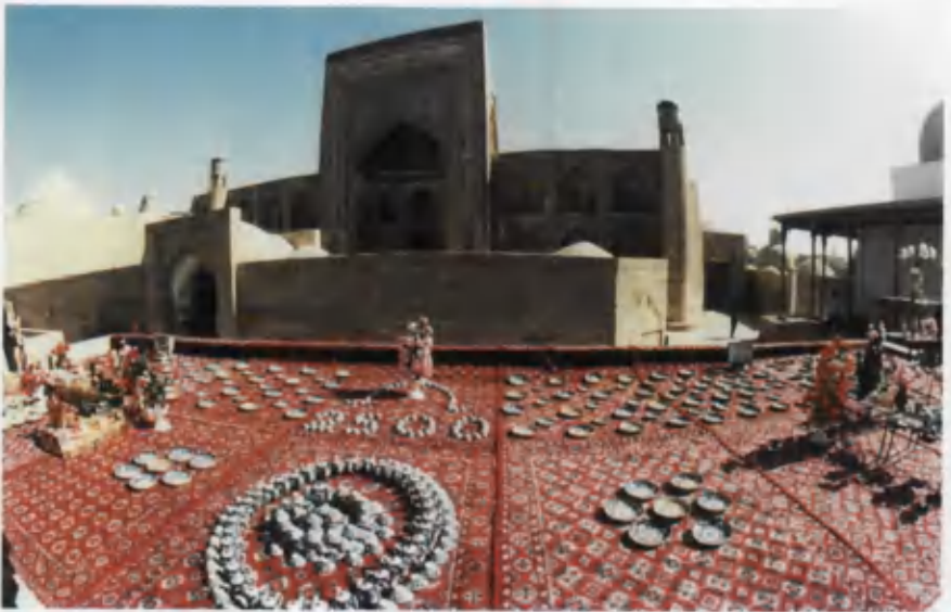
Xiva. O'zbek xalq milliy kulolchilik namunalaridan.