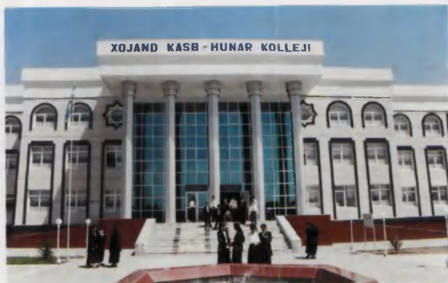
Namangan viloyati. To'raqo'rg'ondagi Xo'jand kasb-hunar kolleji.