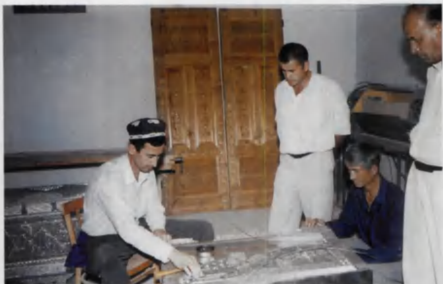
Urgudagi Milliy hunarmandchilik kasb-hunar kollejida.