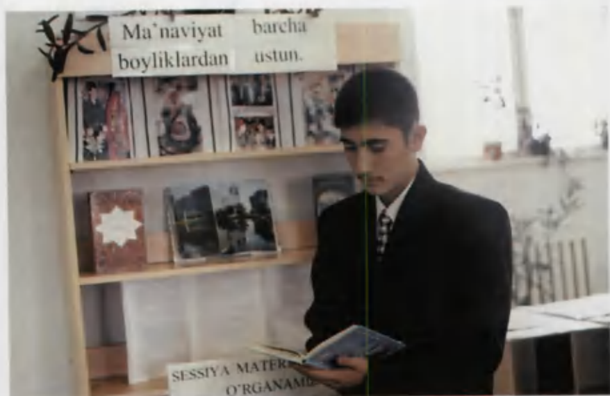
Qiroatxona — bilim o'chog'i.