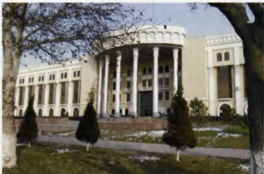
Toshkentdagi O'zbek Davlat Konservatoriyasi binosi.