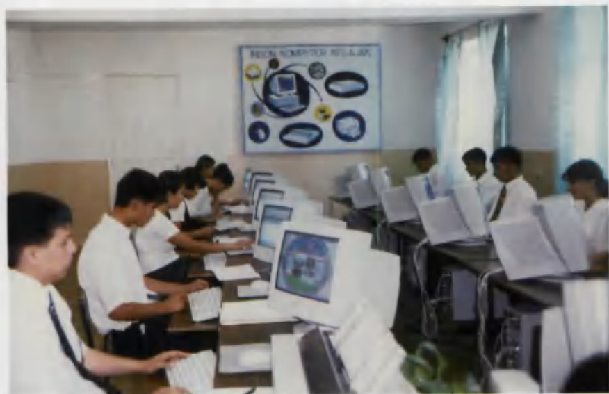
XXI asr — kompyuter asri.