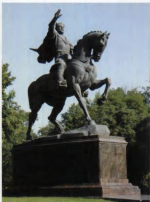
Toshkent shahrida Amir Temurga o'rnatilgan haykal.