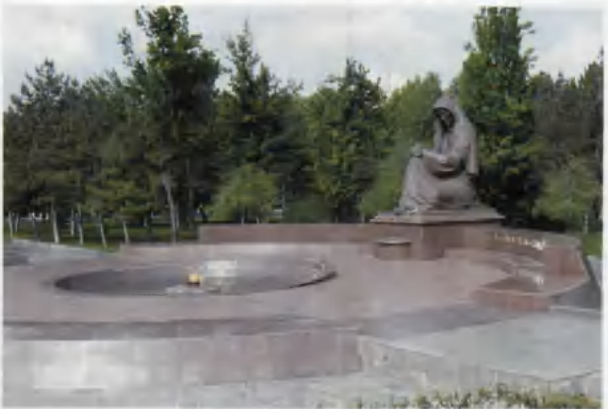
Toshkentdagi «Motamsaro ona» haykali.