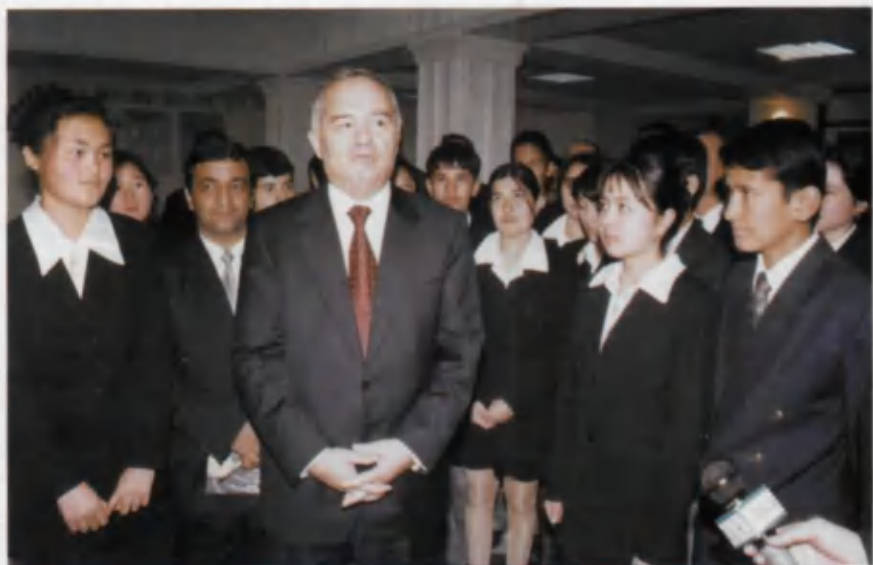
Prezident I.A. Karimov Jahon iqtisodiyoti va diplomatiya universiteti qoshidagi akademik litsey o'quvchilari orasida.