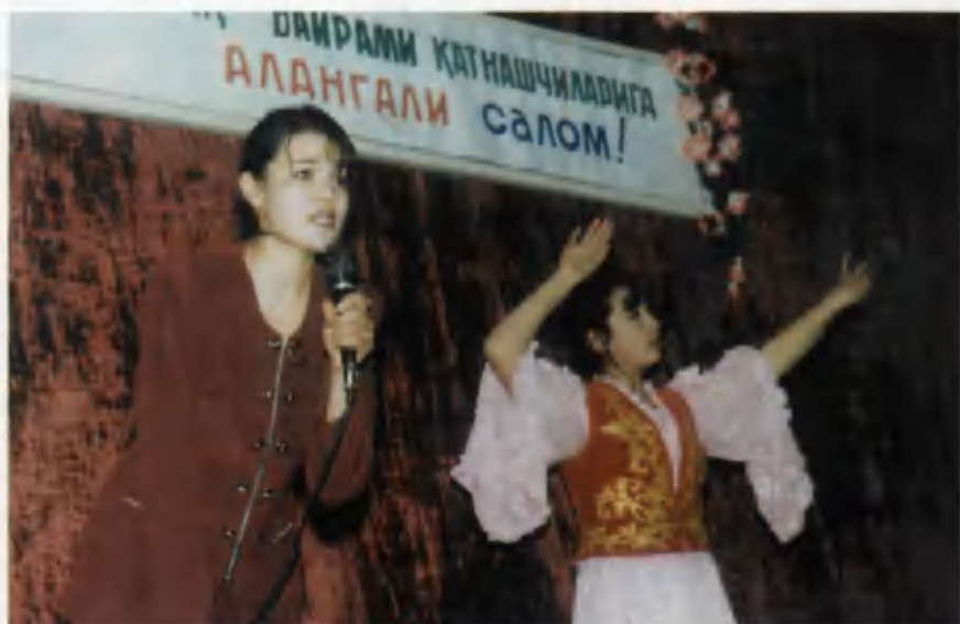
Qo'shiq bayramidan lavha.