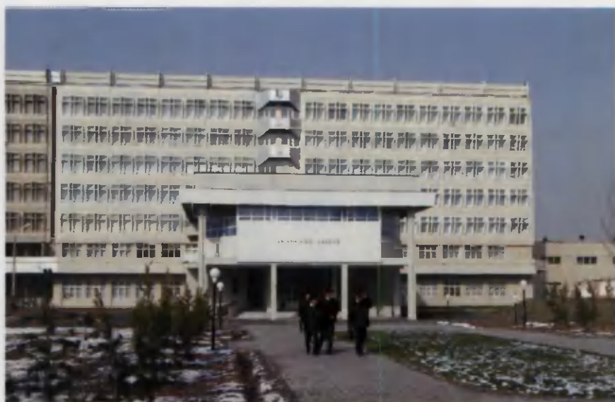
Abu Rayhon Beruniy nomidagi Toshkent Davlat Texnika universiteti qoshidagi Kompyuter texnologiyalari akademik litseyi.