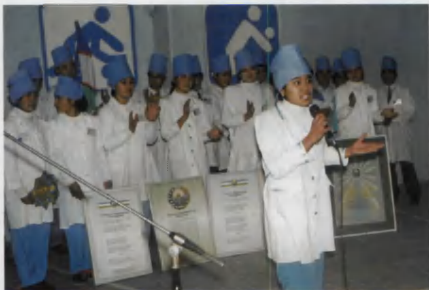
Yosh hamshiralar ko'rik-tantlovi.