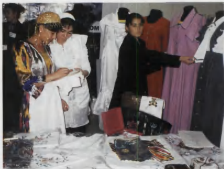
Kollej o'quvchilari tayyorlagan kiyimlar.