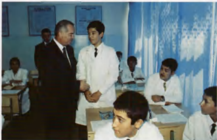
Prezident I.A. Karimovning buyuk maqsad sari intilayotgan yoshlar bilan suhbat.