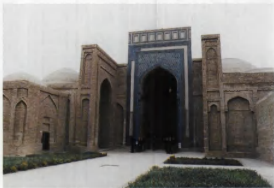
Surxondaryo viloyatidagi Sulton Saodat maqbarasi.