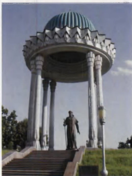
Toshkent. Buyuk mutafakkir shoir Alisher Navoiy haykali.