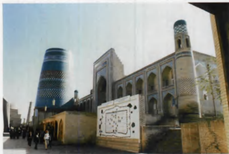
Xiva. Kalta minor madrasasi.