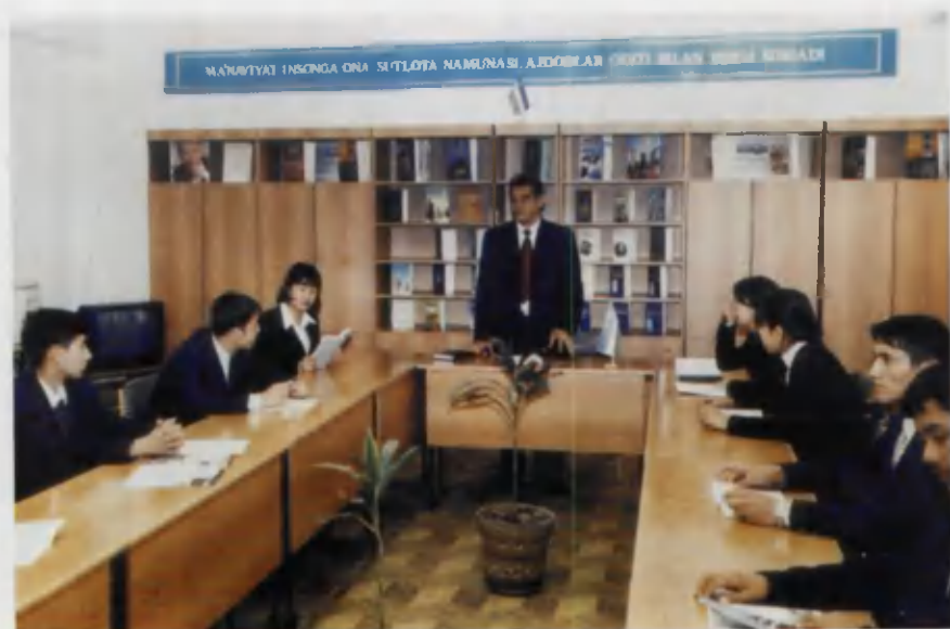
Jahon iqtisodiyoti va diplomatiya universiteti qoshidagi akademik litsey ma'naviyat xonasi.