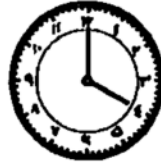
ساعت دَهت چهارهت