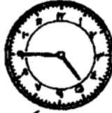
ساعت پنج و سه هت