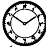
ساعت دو ده و یکه هت