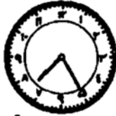
ساعت نُهت و بیست و پنج دقیقه است