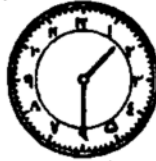
ساعت یکه و نیم هت

1- topshiriq. Quyidagi birikma va iboralarni yod oling va ular yordamida 20 ta gap tuzing.