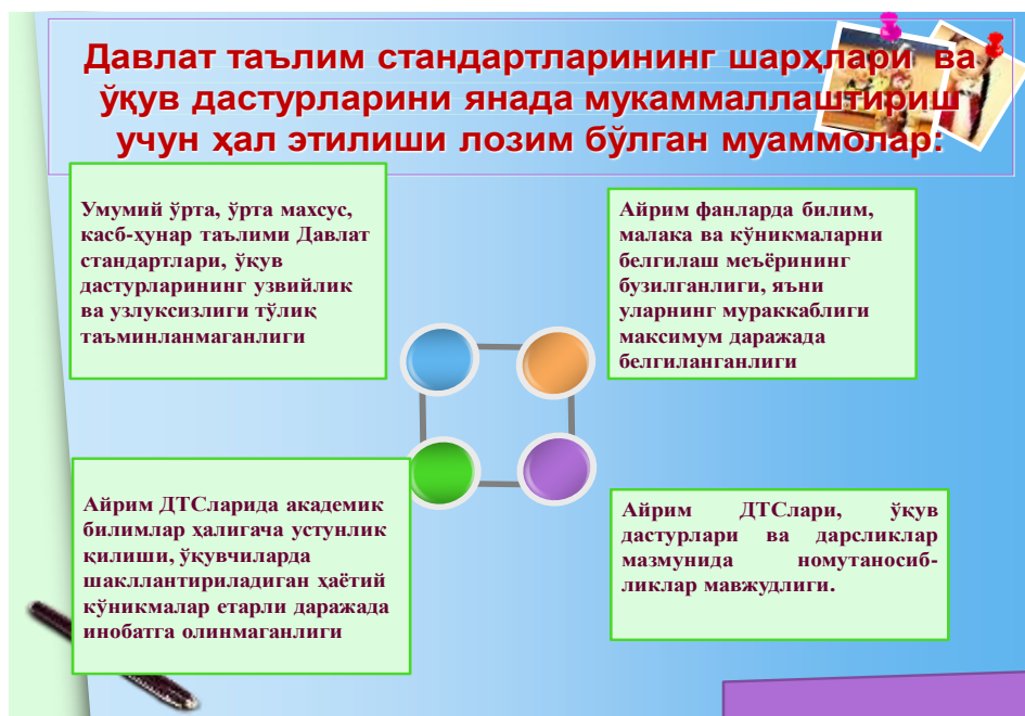
3- rasm. DTS dagi muammolar.