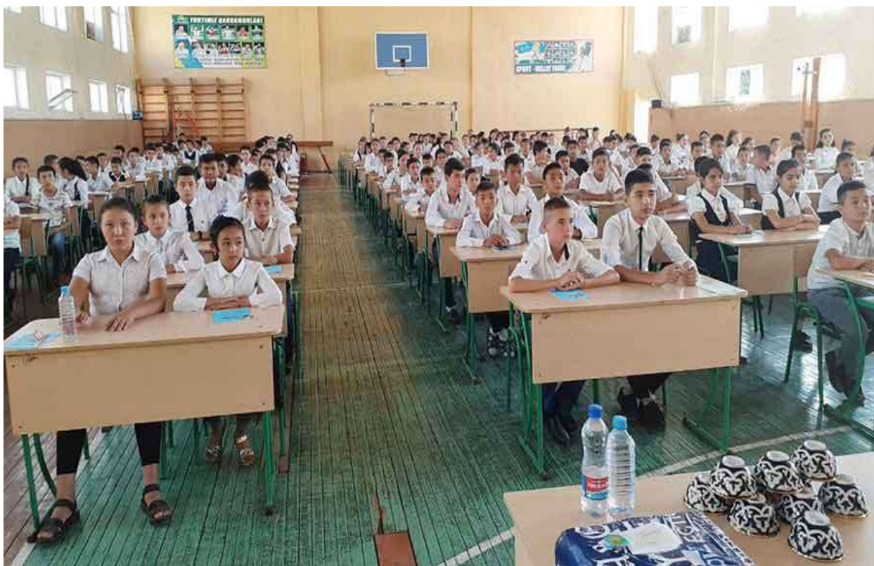
Iqtidorli o‘quvchilarni aniqlash jarayonlari.

Respublikamizdagi 156 ta ixtisoslashtirilgan davlat umumta’lim maktabi va maktab-internatlarda test sinovlarida ishtirok etish uchun 17334 nafar (shundan, 7992 nafar ijtimoiy-gumanitar, 9342 nafari aniq fanlar yo‘nalishida) o‘quvchilar hujjat topshirishgan. Psixologik-pedagogik diagnostika test sinovlarining adolatli va shaffof o‘tkazilishini ta’minlash uchun bu yilgi psixologik testlarni o‘tkazish tartibi va baholash tizimiga bir qator o‘zgartirish va qo‘shimchalar kiritildi. Jumladan, test sinovlari yangicha usul, xalqaro tajribalar hamda Cambridge Assessment International Education tajribalariga asoslangan holda tayyorlandi. Savollar mazmuni o‘quvchilarni ko‘prok mantiqiy va tanqidiy fikrlashga undovchi topshiriqlarga qaratildi.