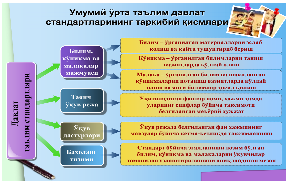
2 - rasm. Umumiy o'rta ta'lim davlat standartining tarkibiy qismlari.

Umumiy o'rta ta'lim muassasalarida ta'lim jarayonlari o'rta ta'lim davlat standartining tarkibiy qismlari asosida tashkil qilinadi. O'rta ta'lim muassasalaridagi asosiy hujjat tayanch o'quv reja va fan dasturlari hisoblanib, o'quv jarayonlari mazkur hujjatlar asosida boshqariladi.