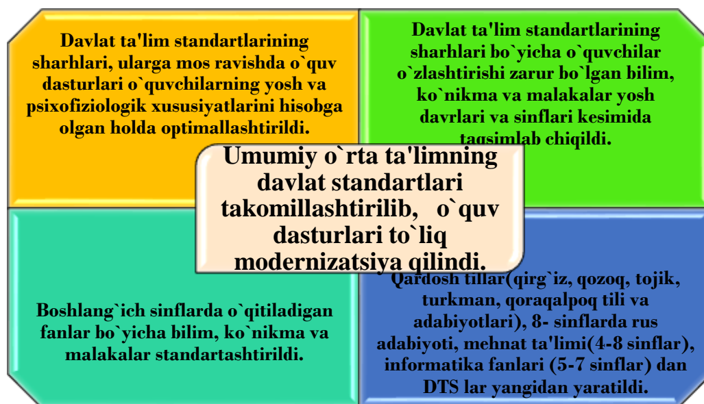
4- rasm. Davlat ta'lim standartlari modernizatsiyasi.

Biologiya ta'lim standartidagi o'quvchilarga beriladigan bilimlar majmuasining 3-yo'nalishi "Organik olam evolyutsiyasi" deb nomlanib, uch ta'lim yo'nalishi bo'yicha biologiya DTSda o'quvchilar o'zlashtirishi lozim bo'lgan majburiy minimal bilimlar majmuasi keltirilgan. Biologiya ta'lim standartida