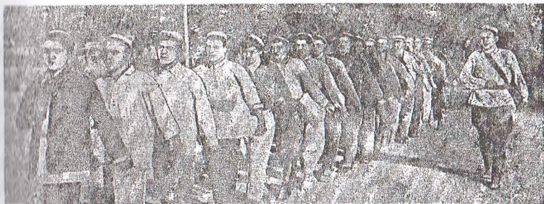
Мамлакатнинг корхона ва колхозларида армиянинг жанговар резервларига тайёргарлик ишлари кетяпти. Сурагда: Самарқанд районидаги собиқ “Октябрь” колхозида жанговар машгулот пайти.