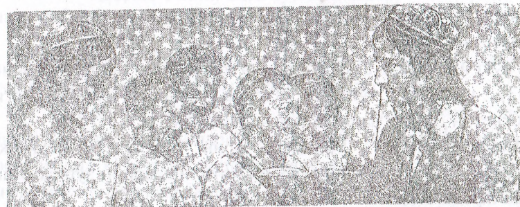
Самарқанд шаҳридаги 8-мактабнинг биринчи синф ўқувчилари ўз ўқитувчиси Убаро Тўраева билан танишмоқдалар.

иштирок этиб, фашизм устидан ғалабага эришишда ўз ҳиссаларини қўшдилар.