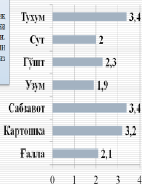
Қишлоқ хўжалиги маҳсулотлари етиштиришнинг кўпайиши, 2000 йилга нисбатан баробар