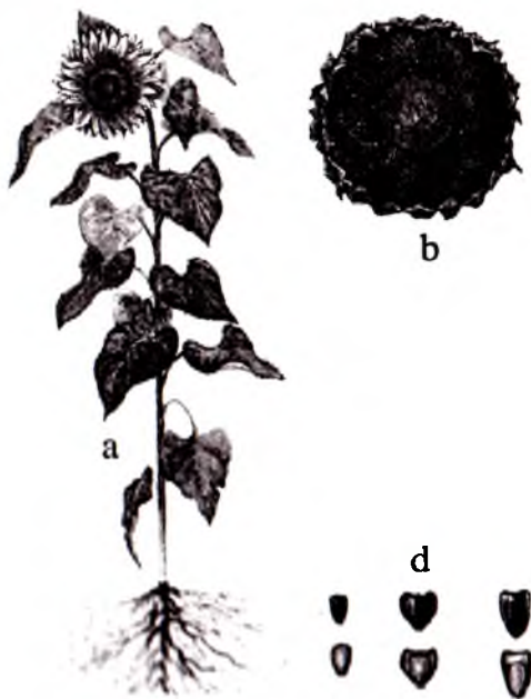
13-rasm. Kungaboqar; a-umumiy ko'rinishi; b-savatchasi; d-pistalari

5. To'la pishish savat sariq, jigar rangli bo'ladi. Pistasining namligi 18-12 foizga kamayadi.