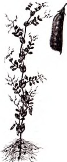
7-rasm. Ko'k no'xat va uning dukkagi

Urug'i ko'pincha yirik, yumaloq, burchakli bo'ladi. Urug' kattaligiga qarab 1000 tasining vazni 150-250 g bo'ladi. Urug'ning yuzi silliq yoki