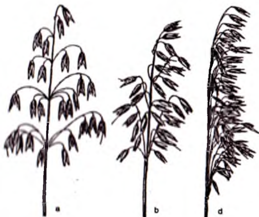
3-rasm. Suli ro'vagi: a-tarqoq; b-qum sulisi; d-bir yonli suli

Ekish. Suli ekish uchun yerni ishlash, ekish muddati, me'yori va usuli hamda ekish chuqurligi, shuningdek parvarish va hosilni o'rib yanchib olish arpanikiga o'xshashdir. Ko'kat uchun ekilganda esa doni sut pishish davrida o'rilganda mo'l va sifatli ozuqa olinishni ta'minlaydi. Bahorda ekishni erta muddatda o'tkazish ( fevral oxiri martning boshlarida) yaxshi natija beradi. Takroriy ekinlarni ekish uchun kech bo'shashiga olib keladi.