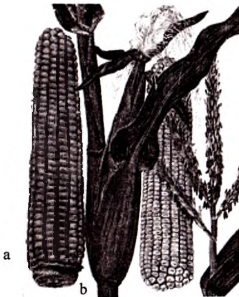
4-rasm. Makkajo'xori: a) so'tasi; b) qobiqqa o'ralgan so'tasi

bo'ladi. O'zbekistonda makkajo'xorining nav va duragaylaridan Vatan, O'zbekiston – 306, O'zbekiston – 601, Kremnistaya, UzROS, Dneprovskaya-70, Uzbekskeya zubovidnaya va boshqa navlar ekiladi.