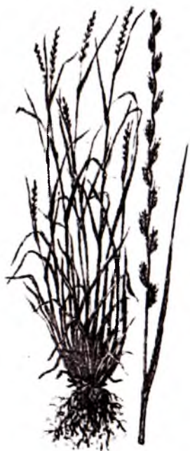
17-rasm. Ko'p o'rimli mastak