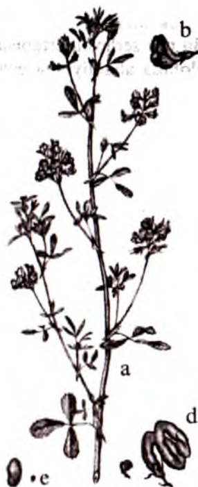
14-rasm. Beda: a) umumiy ko'rinishi; b) guli; d) dukkagi; e) urug'i

Dukkagi burama shaklda, 2-5 marotaba buralgan, 6-12 ta urug' bo'ladi. Dukkagi mayda, diametri 3-5 mm, tukli va tuksiz bo'ladi, rangi sariq, jigar va qora bo'ladi.