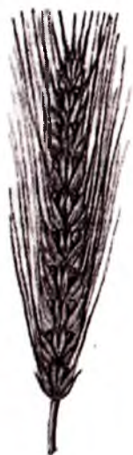
2-rasm. Javidar. javdar asosan oraliq ekin sifatida kuzda ekilib, ko'k massa olinadi.

tuzilishi, donining shakli bug'doy va javdarni eslatadi. Ammo javdar va bug'doydan quyidagi belgi va xususiyatlari bilan ajralib turadi: javdarning poyasi yo'g'on, pishiq, yotib qolishga chidamli, bargi va boshog'i katta, doni ham yirik. Javdarning doni ingichkaroq, tritikaleniki esa to'laroqdir (2-rasm).