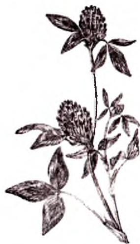
15-rasm. Qizil sebarga

Poyasi o'tsimon, tik o'sadi, sershox, ichi kovak, siyrak tupli, 5-10 ta bo'g'im oraliqlari mavjud, bo'g'im oraliqlarining uzunligi 10-20 sm, poyaning balandligi 1,0-1,5 m bo'ladi. O'simlik yaxshi tuplanadi, 10 tagacha poya hosil qiladi.