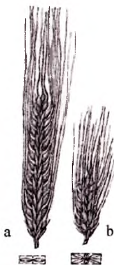
1-rasm. Arpa: a-ikki qatorli arpa; b-ko'p qatorli arpa

Ikki qatorli arpada ham boshqoq o'qining har bir ustunchasida uchtadan boshqoqcha