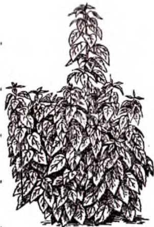
9-rasm. Topinambur (yer noki)

Topinamburni bir yerda 10 yil, hatto 40 yil o'stirilgani to'g'risida ma'lumot bor. Fyuzo, Patta, Kievskaya. Belaya, Severokavkazakaya krasnaya, MLOS-650YU, Belyi urojayniy, Vadim va Krasnoklubneviy va boshqa navlari keng tarqalgan (9-rasm).