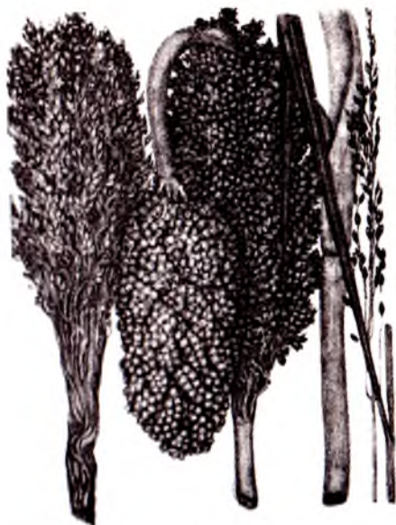
5-rasm. Oq jo'xori

Gulto'plami supurgisimon, poya va yon shoxlarning uchida joylashadi. Gulto'planning asosiy o'qi poya davomi bo'lib, undan yon shoxlar paydo bo'ladi va uning uchida boshqochalar, ya'ni gullar, don joylashgan bo'ladi. Jo'xorining supurgisimon turlarida tarqoq, donli navlarida egilgan zich, qandli navlarida esa yarim tarqoq shaklga ega bo'ladi (5-rasm).