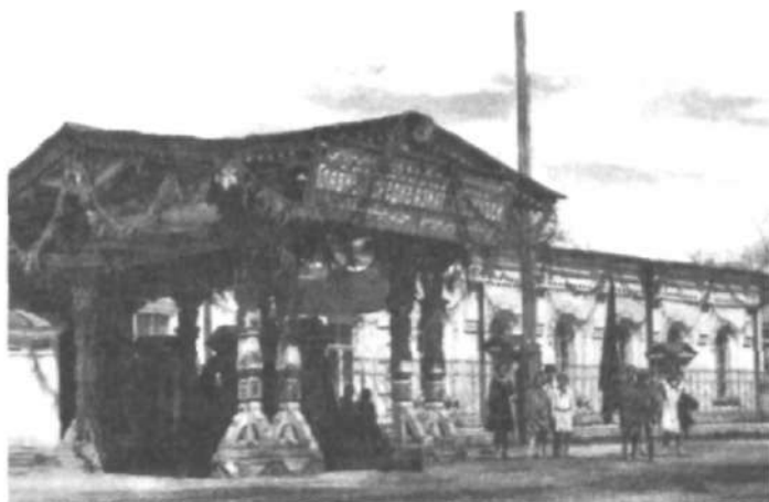
Toshkent muzeyining XX asr birinchi yarmidagi ko'rinishi

Muzey moddiy holatining og'irligi kolleksiyalarning yo'qolishi, bo'limlarning qisqarishiga olib keldi. 1900-yilga kelganda faqat etnografiya, arxeologiya va numizmatika bo'limlarigina faoliyat ko'rsatar edi. O'sha yili ro'yxatga olingan kolleksiyalar holatiga qarab, ekspozitsiyalar haqida fikr yuritish qiyin emas. Ro'yxat besh qismdan: gravyura va fotosuratlar; dafn etish va qabrtoshlar bilan bog'liq ashyolar; uy-ro'zg'or buyumlari; kichik arxeologik ashyolar; numizmatika kolleksiyalaridan iborat edi.