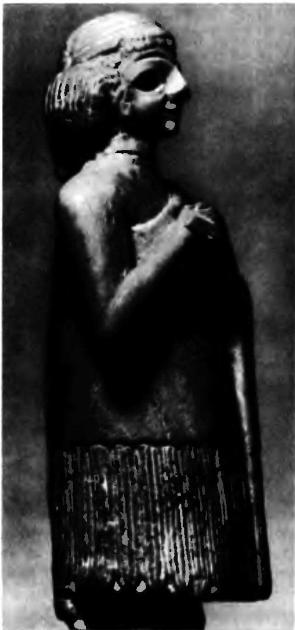
1 Женская статуэтка из Лагаша. Середина III тыс. до н.э. Лондон, Британский музей.

покрытый саваннами и тропическими каменистыми и щебнистыми пустынями, пересеченными длинными грядами высоких песчаных барханов. Пустыни эти прорезаны с юга на север узкой зеленой полосой, тянущейся на тысячи километров и окаймляющей реку Нил. В среднем течении Нила расположено несколько гряд порогов, самый нижний из которых находится у современного города Асуан. К северу отсюда в древности начиналась историческая область Египет. Область к югу от первого порога называлась Кушем или (с X века н.э.) Нубией. От азиатской части Ближнего Востока Египет отделяет полоса Суэцкого перешейка и пустыня Синай, а также Южная Палестина, к которой с юга примыкает огромный покрытый пустынями Аравийский полуостров, расположенный между Красным морем, Индийским океаном и Персидским заливом. К северу от него, между Средиземным, Черным, Каспийским морями и Персидским заливом находится так называемая Передняя Азия. Она разделена по диагонали реками Евфратом, текущим с северо-запада на юго-восток, с Армянского нагорья в Персидский залив, и Тигром, текущим восточнее, параллельно Евфрату (область между Тигром и Евфратом называется Месопотамией или Двуречьем), и граничит к западу от Евфрата с Сирийско-Аравийской пустыней, а в северной части окружена с трех сторон горными районами Палестины, Ливана, Сирии (к которой на северо-востоке примыкает полуостров Малая Азия или Анато-