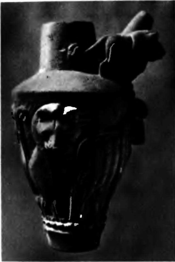
2 Сосуд с рельефными изображениями львов и быков. Урук. Период Джемдет-Наср. Ок. 2700 г. до н. э. Багдад, Иракский музей.