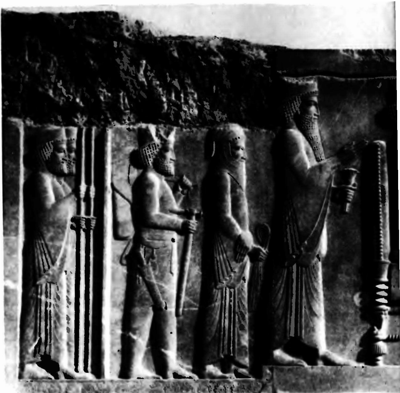
4 Прием Дарием I знатного мидийца. Рельеф сокровищницы царя Дария I в Персеполе. Конец VI – начало V вв. до н.э. Тегеран, Археологический музей.

различия между патриархальным рабством стран Древнего Востока и античным, это различные стадии развития одной социально-экономической формации. Характерна для Древнего Востока и эксплуатация оторванных от средств производства, подобно рабам, различных прослоек людей, формально считавшихся свободными, а также свобод-