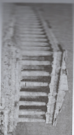
# nom, Parfenon ibodatxonasi. Afna

Afnada quldorlik demokratiyasining rivoji. Yunon shahar davlatlarining raqobati va Afna demokratiyasining rivoji Yunonistonda fors bosqini bartaraf qilish jarayonida kuchli ehtiyojga asoslangan demokratiya shakllandi. Uchinchi bosqini oldini olishga qaratib, ko'plab yunon polislari urushda harbiy dengiz kuchlari hisobidan alohida o'rin egallagan Afna boshchiligidagi ittifoqqa a'zo bo'ldi. Bu ligadan kelgan daromadlar natijasida Afna polislarning mavqei yanada ortadi, jamiyatda boshqaruv ishlarida alohida o'rin egallagan erkaklar soni ko'paygan. Oddiy fuqarolar