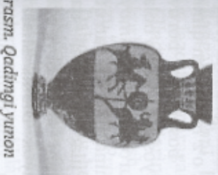
10-rasm. Qadimgi yunon amforasi

qatnashchilari echkining terisini kiyib, yo'lodosh Dionisni satirik (kulgili taqlid) aks ettirishadi. Ular quvnoq xudosi haqida afsonaviy sahna ko'rinishlarini ijro etadilar va uni mashhur qiluvchi diframb (madhiya) kuylaydilar. Miloddan avvalgi VI asrda bu qo'shiqlardan fojiali sahna ko'rinishlari paydo bo'ldi (eчки qo'shig'i). Teatr demokratik Afina hayotining asosiy elementlaridan biriga aylandi. Shahar aholisi hayotining agonal xarakterining asosiy xususiyatlari, madaniyati aniq va ravshan tarzda qadimgi Yunon teatrlarida mujassamlashtirilgan.