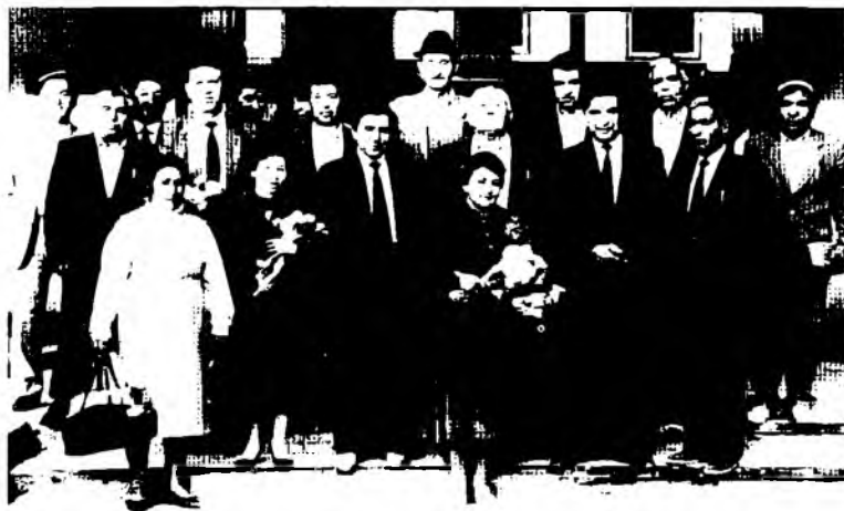
Учрашувдан сўнг... (1990-йиллар)