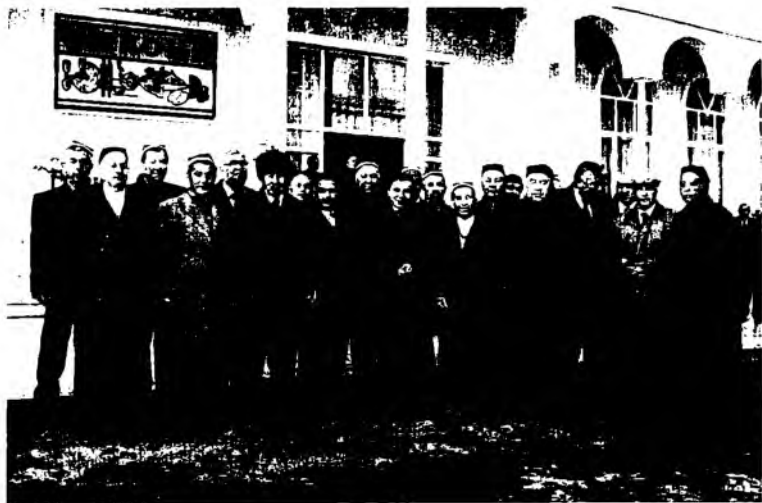
Синфдошлар. Ярим асрни ортда қолдириб...