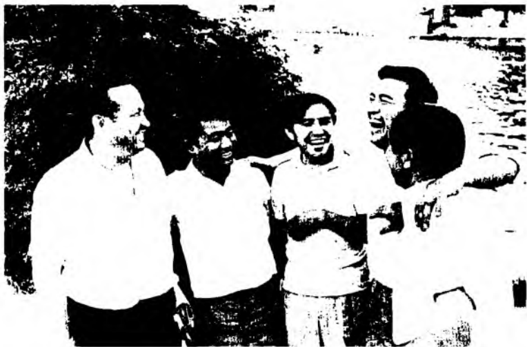
“Оқшом”чиларнинг нурли оқшомлари

халқининг байрами десангиз, байжонлар нима қилади? Масалан, дунёда қўшалок исмли халқлар бўлади, қўшалок исми шаҳарлар бор. Будапешт шаҳрини олайлик. Дунай дарёсининг бир бетида “Буда”, иккинчи бетида “Пешт”. Шунинг учун Будапешт дейилади. Ёки Чехословакия. Агар Ўзбекистонда Чехословакия маданият кунлари бўлса, сиз чех халқининг байрами десангиз, словаклар тўполон қилиб юборади-ку! Озарбайжонлар ҳам шунақа. Озорлар билан байжонлар ҳам бор. Масалан, Эронда 3 миллион байжон яшайди. Яхшиси, сарлавҳани “Озар ва байжон халқлари байрами” деб қўйинг”.