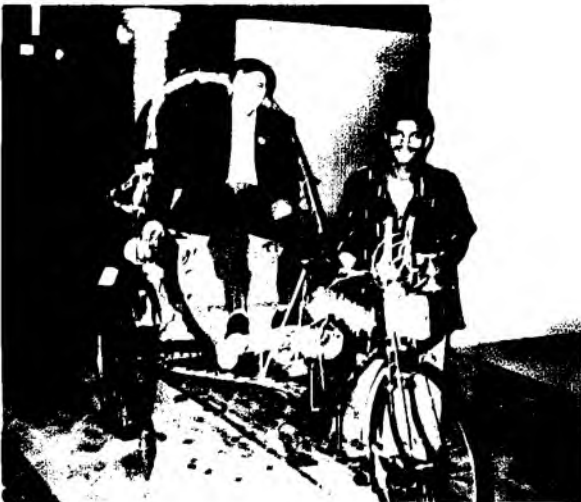
Бангол велорикшасида (1999) ////////////////////////////////////