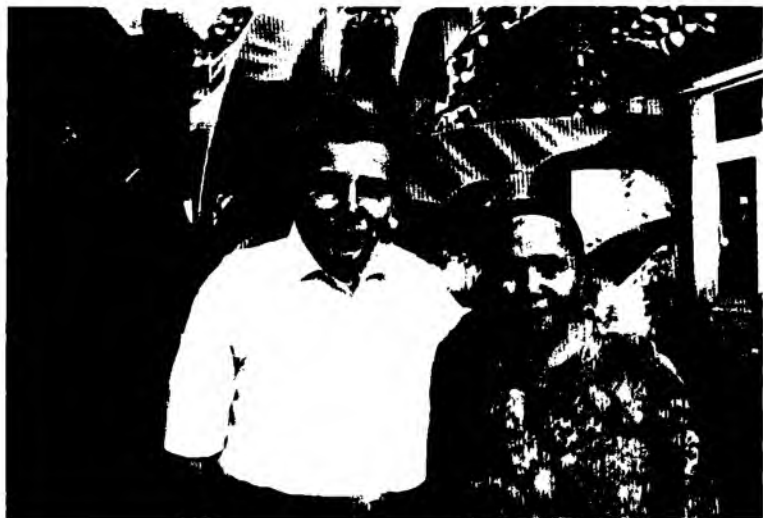
Адиб отаси Озодахон ая билан (2010)