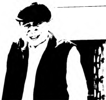
Сўнгги суратлардан ////////////////////////////////////