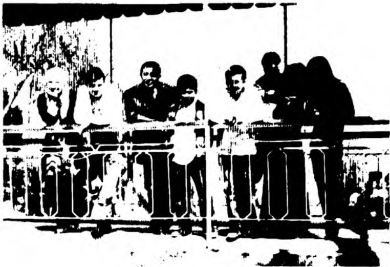
Бебаҳо хазина – фарзандлар, набиралар... (2011)