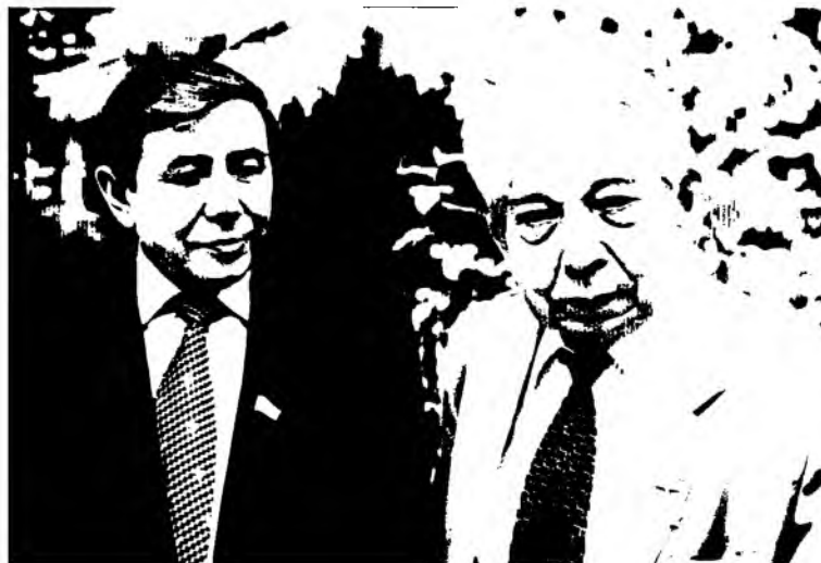
Ўзбекистон Қаҳрамони Саид Аҳмад адибнинг ижод ва ҳаётдаги устози эди (2001)