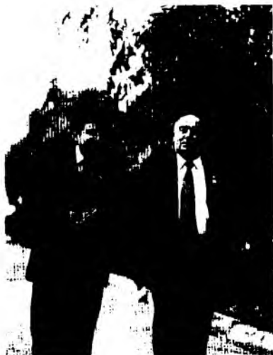
Бир умрлик дўст-қадрдонлар

ри дostonларигача, теран фалсафий қасидаларидан тортиб, майин, хушчақчақ ҳажвга йўғрилган туркумларигача барчасида кўзга ташланиб туради.