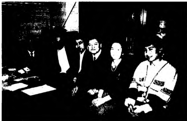
“Шарқ юлдузи” журнали таҳририятидаги жамоадошлар

Муҳаррир сифатида, эртами-кечми, шундай гап чиқишини билар эдим. Эркин Воҳидовнинг “Истанбул фожиаси”, Пиримқул Қодировнинг “Авлодлар довони” асарларини эълон қилиш ҳам осонликча кечган эмас (кези келганда айтиш керак, яқинда Қуръони каримнинг таржимаси чиқиш арафасида ҳам “эҳтиросли ва мурасасиз” курашлар бўлди. Ҳолбуки, 88-йил қаёқдаю 90-йил қаёқда? Ҳаётимиздаги инқилобий ўзгаришлар суръати шиддат билан кечяпти. Лекин инсон онгидаги силжиш ҳаётдаги ўзгаришга нисбатан ҳар доим секинроқ ва қийинроқ рўй берар экан).