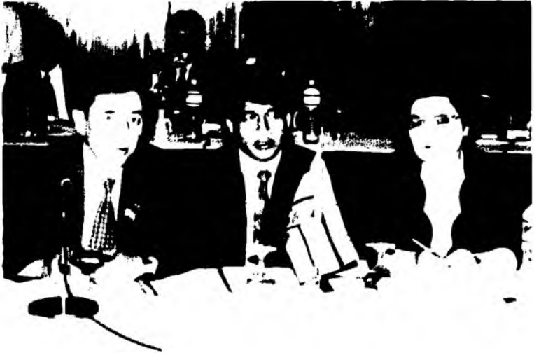
Ўзбекистон Республикаси Олий Мажлисининг инсон ҳуқуқлари бўйича Вакили (Омбудсман) Сайёра Рашидова билан халқаро анжуманда (Бангладеш, 1999) ////////////////////////////////////