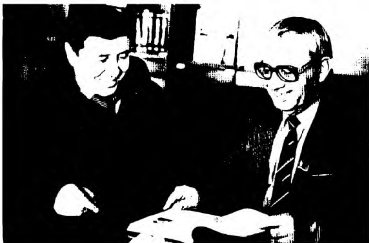
Ўзбекистон халқ ёзувчиси Асқад Мухтор билан (1980-йиллар)