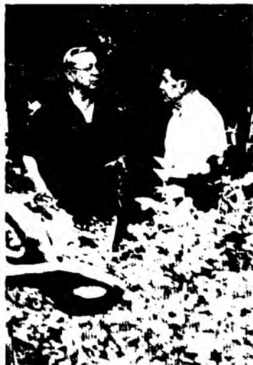
Алимардон Тўраев – “Баҳор қайт-майди” видеофильмидаги роли би-лан элга танилган Ўзбекистон халқ артисти Лутфулла Саъдуллаев би-лан боғда суҳбат (2006) ////////////////////////////////////