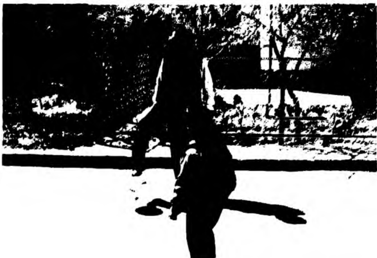
“Додажон, мен билан футбол ўйнайсиз!” (2011)