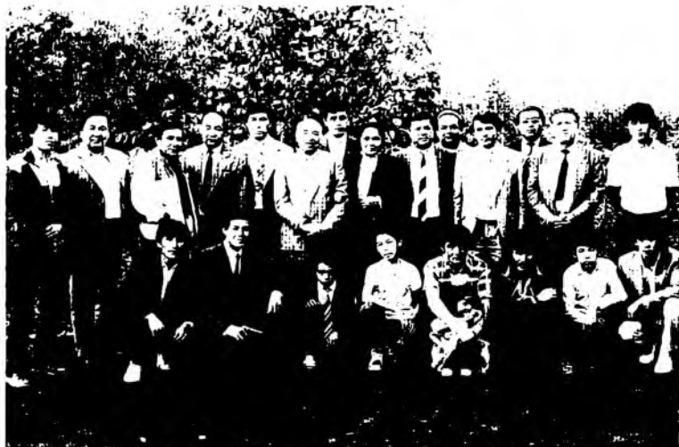
Вилоятларга сафар (1991)