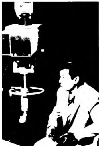
Ўзбекистон телевидениеси орқали амойиш этилган “Баҳс” кўрсату-ни мухлислар ҳануз эслайдилар (1983) ////////////////////////////////////