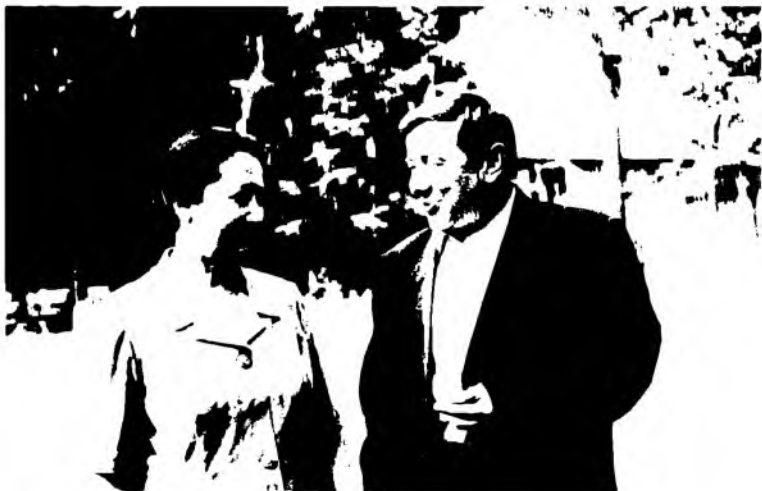
“Эй жуфти ҳалолим, не ғамимиз бор...” (2001) ////////////////////////////////////