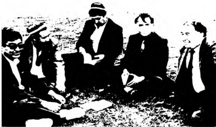
Ҳенглик – дастурхон, китоблар – неъмат. Ижодкорлар табиат қўйнида (Нурота, 1997)