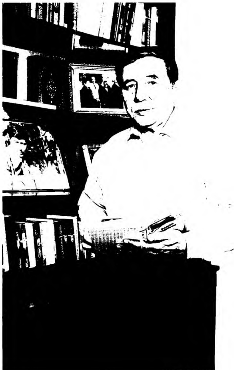
“Ҳар бир асарим – дардим маҳсули” (2007)