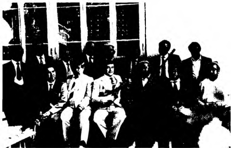
Ўз ила оҳанг қовушганида... (1990-йиллар)