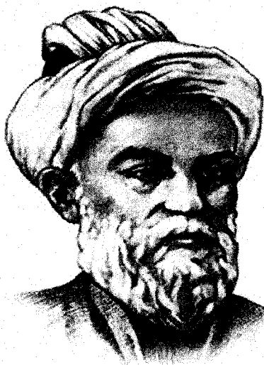
АВИЦЕННА (Абу-Али ибн Сина) ок. 980-1037