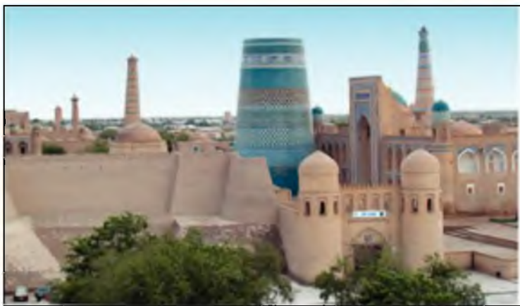
Xiva. Ichan qal'a.

Muhammad Aminxon Ichan qal'aning g'arbiy qismidagi