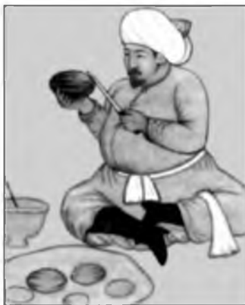
Abdullaxon II (miniatura, 1572).

Abdullaxon II Xorazm va Xurosonni Movarounnahrğa birlashtirish yo'lida ko'p jang-u jadallar olib bordi. Chunonchi, 1574 — 1595- yillar oralig'ida Balxni, Samarqandni, Toshkent va Farg'onani, Badaxshonni hamda Xorazmni zabt etdi va o'z davlati tarkibiga qo'shib oldi. Shundan keyin uning davlati sarhadlari janubda Hirotdan Mashhadgacha, shimolda Orol dengizigacha, Kaspiy dengizidan Issiqko'lgacha yetdi. Butun Movarounnahr, Xorazm va Xuroson yana yagona hukmdor qo'li ostida birlashtirildi. XVI asr oxirlariga kelib Buxoro xonligi nisbatan markazlashgan ulkan davlatga aylandi.