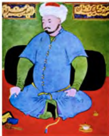
Muhammad Shayboniyxon (XVI asrda ishlangan miniatura).

Shayboniyning xizmatidan ham Mo'g'iliston, ham Movarounnahr, ham Xuroson hukmdorlari o'zlarining qo'shnilariga hamda ichki raqiblariga qarshi kurashda foydalanganlar. Bu kurashlarda Shayboniy o'zining mohir lashkarboshilik qobiliyatini namoyon qildi. Turli hukmdorlarga xizmat qilish Shayboniyga Temuriylar davlatidagi vaziyatni yaxshi bilib olishga imkon berdi.