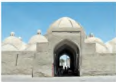
Buxoro. Toqi telpakfurushon (telpak do'koni).

Hunarmandchilik ishlab chiqarishining asosiy tarmoqlaridan yana biri — temirchilik va mislik bo'lib, o'roq, pichoq, shuningdek, qurol-yarog' yasashgan. Temirchilar qilich, xanjar, oybolta, nayza, qalqon, kamon va uning o'qini yasash edilar. To'plar yasash ham yo'lga qo'yilgan. Zargarlik, kulolchilik, yog'och-