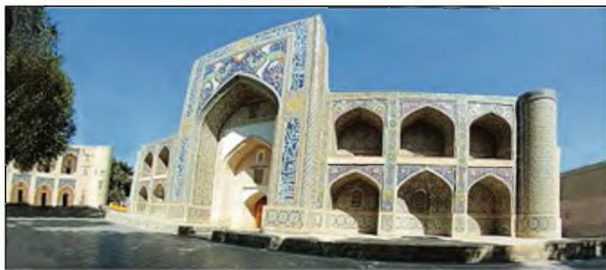
Buxoro. Nodir devonbegi madrasasi.

berish, bezash ishlari bajarilgan. Samarqand Registon ansambli o'zining rang-barang koshinkor bezaklari, naqshinkor pesh-toqlari, ulkan gumbazlari bilan Markaziy Osiyo me'morchiligining noyob tarixiy yodgorligi bo'lib, bugungi kunda jahon jamoatchiligi, sayyohlar e'tiborini o'ziga jalb qilmoqda.