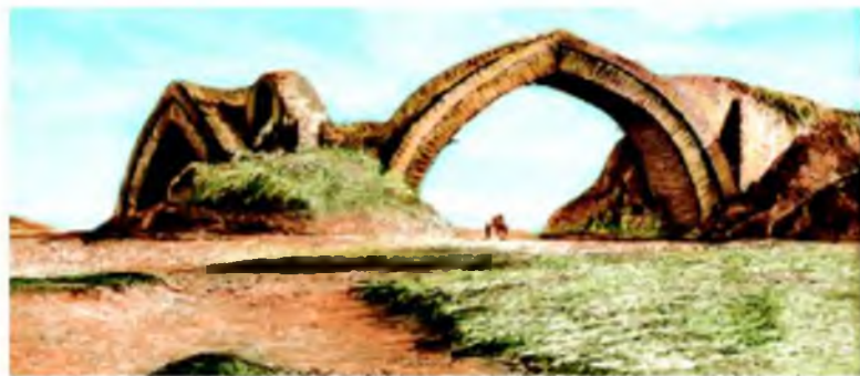
Zarafshon daryosida qurilgan ko'prik — suv ayirg'ich.

daryosida Karmana, Mehtar Qosim, Chahorminor, Jondor suv ayirg'ichlari; Nurota tog'ida Oqchob, Murg'ob vohasida Hovuzixon suv omborlari qurilgan. Bundan tashqari, Sangzor daryosidan Jizzax vohasiga Tuyatortar kanali, Somonjuq dashtini obodonlashtirishga xizmat qilgan Xoja Ka'ab kanali, Afshona kanali, Amudaryodan Chorjo'yga, Murg'obdan Marvga, Vaxshdan uning atrof vohalariga suv chiqarishga imkon beruvchi kanallar qazilgan.