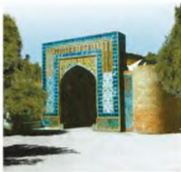
Daxmayi Shohon maqbarasi.

Umarxon Turkiston va uning atroflarini — Orolboʻyidan Yettisuvgacha egallab, Oqmachit (Qizil Oʻrda), Avliyoota (Jambul), Pishpak (Bishkek) qalʼalarini bunyod etdi. Qoʻqon va boshqa shaharlarda