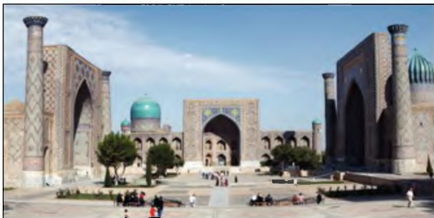
Samarqand. Registon ansambli.

XVII asrda Samarqand Registoni ansamblining hozirgi qiyofasi shakllantirildi. Samarqand hokimi Yalangto'sh Bahodir 1619 — 1635- yillarda vayrona holatiga tushib qolgan Registon maydonida Ulug'bek madrasasi qarshisida Sherdor madrasasini , uning yonida 1646 — 1660- yillarda Tillakori madrasa-masjidini o'z mablag'lari hisobidan bunyod ettirgan, unga tilladan ishlov