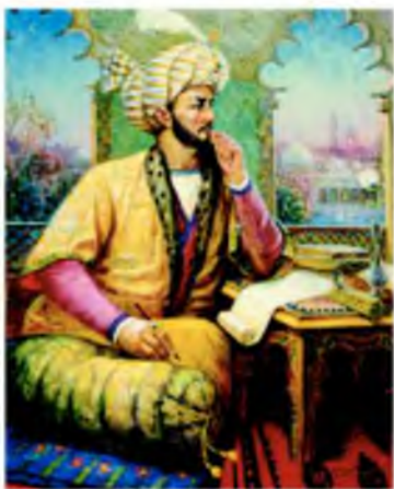
Zahiriddin Muhammad Bobur.

1510-yili Shayboniyxon halok boʻlgach, Bobur Mirzo shoh Ismoil yordamida Movarounnahrni shayboniylardan qaytarib