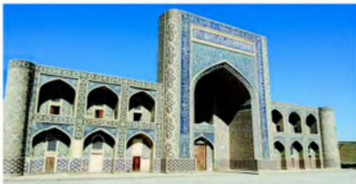
Buxoro. Abdullaxon madrasasi.

Muhammad Shayboniyxon Buxoro va Samarqandni temuriylardan so‘ng fan, madaniyat va san‘at markazlari sifatida rivojlantirishga harakat qildi. Shayboniylar ta’limni rivojlantirish maqsadida islohot ham o‘tkazganlar. Bu islohotning o‘tkazilishiga