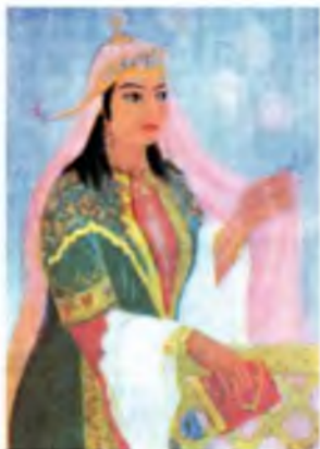
Nodira (o‘z davrida ishlangan miniatura).

O‘zbek shoirasi, ma‘rifatparvar davlat arbobi Mohlaroyim — Nodira (1792 — 1842) Andijonda tug‘ilgan. Otasi Rahmonqulibiy Andijon hokimi bo‘lib, Qo‘qon xoni Olimxonning tog‘asi edi.