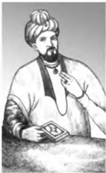
Hukmdor va alloma Abulg'oziy Bahodirxon.

1616-yili Arab Muhammadxonning o'g'illari Habash Sulton bilan Elbars Sulton ayrim qabilalarning boshliqlariga tayanib, otalariga qarshi isyon ko'tardilar. Ota farzandlariga yon bosishga majbur bo'ldi. Ular boshqaruviga topshirilgan hududlarga Vazir shahrini ham qo'shib berdi. Biroq, bu bilan nizo tugamadi. 1621-yili ular yana isyon ko'tarishdi. Bu safar otalari Arab Muhammadxon tarafida uning boshqa ikki o'g'li — Asfandiyorxon va Abulg'oziy Sulton urushda qatnashdilar. Bu urushda Habash Sulton va Elbars Sulton qo'shinlari g'olib keldi. Noqobil farzandlarning amri bilan asir olingan ota Xivaga keltirib qamab qo'yildi, keyinroq qatl etildi.