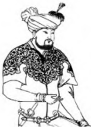
Husayn Boyqaro (Behzod tomonidan ishlangan miniatura).

Xuroson hukmdori Shohrux Mirzo 1447-yili vafot etgach, toj-u taxt uchun kurash kuchaydi. Natijada, Xuroson davlati bir necha qismlarga bo‘linib ketdi. Ularning har biri o‘zini mustaqil davlat deb hisoblar edi. 1469-yilda Amir Temurning ikkinchi o‘g‘li