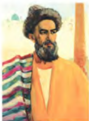
Mashrab (O‘zbekiston xalq rassomi D. Imomov asari).

Nodira olimlar, xattot va naqqoshlarni Qo‘qonga to‘plagan, ko‘p kitoblarni qayta ko‘chirtirgan. Kitob muqovasining did bilan ishlanishiga e‘tibor beradi. Yaxshi xattotlarga, naqqoshlarga tilla qalam, kumush qalamdon sovg‘a qilgan.