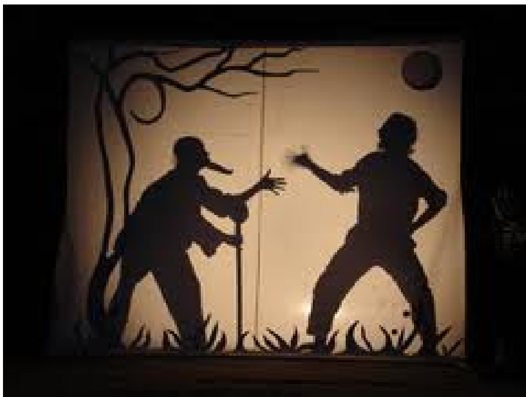
“Oyni kim o‘g‘irladi”, rejissyor F.Xo‘jayev

ham, dekoratsiya ham bo‘lmaydi. Tomoshabinlar orqasidan nur bilan yoritiladigan katta oq ekran qarshisida o‘tiradilar. Qo‘g‘irchoqboz – aktyorlar ham ekran qarshisida (ammo uning orqa tomonida) o‘tiradilar. Ular nozik suyak tayoqchalar bilan tekis qo‘g‘irchoqni ekranga taqab chiqadilar, natijada aniq soya yaqqol ko‘rinadi.