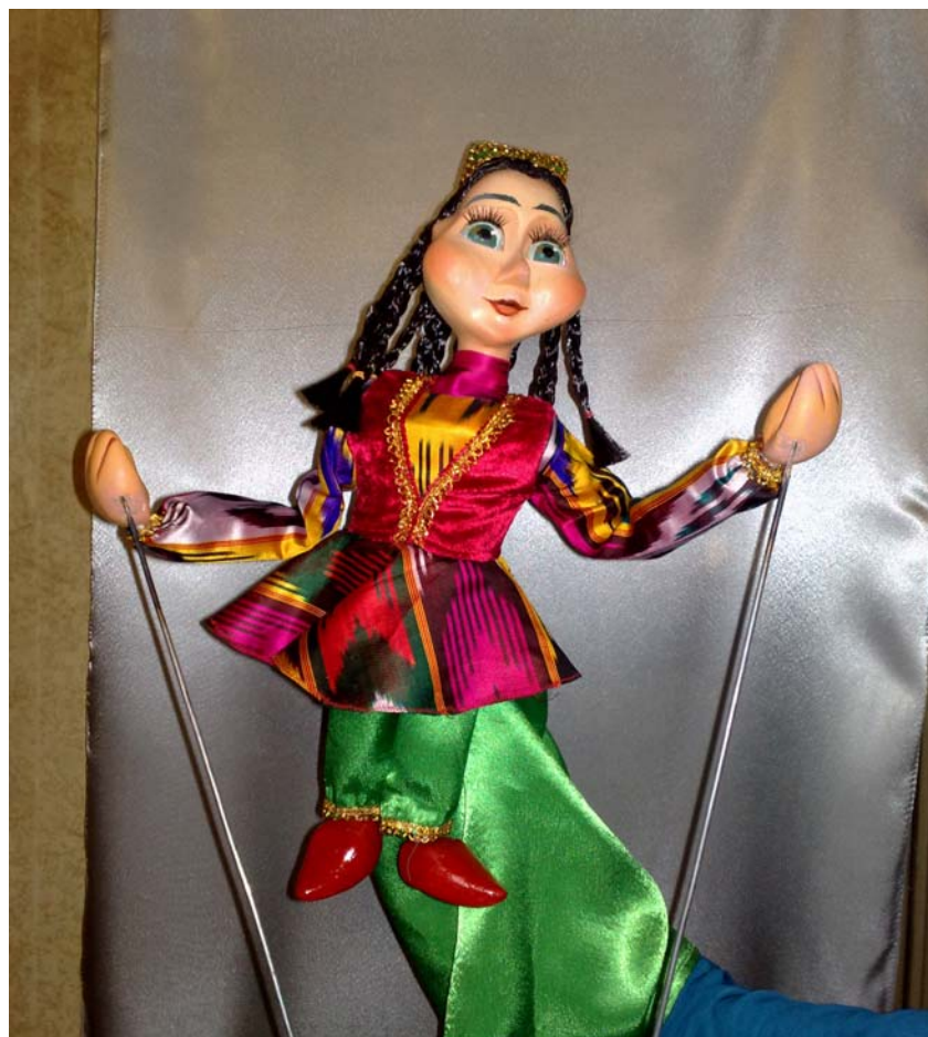
“O‘z uyingni o‘zing asra”, rejissyor M.Ashurova

Qo‘lqopli va simli qo‘g‘irchoqlar (verxovoy) tepa qo‘g‘irchoqlardir, chunki ularni aktyor pastda, maxsus shirma ortida turib bajaradi.