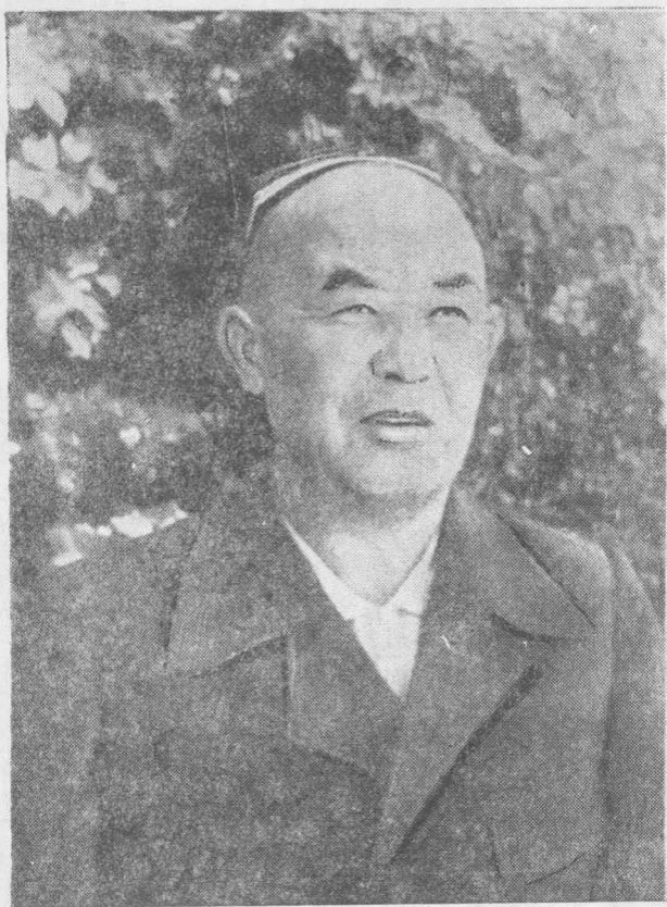
Машҳур ашулачи ва аскиячи Жўрахон ака Султонов (1903—1966).