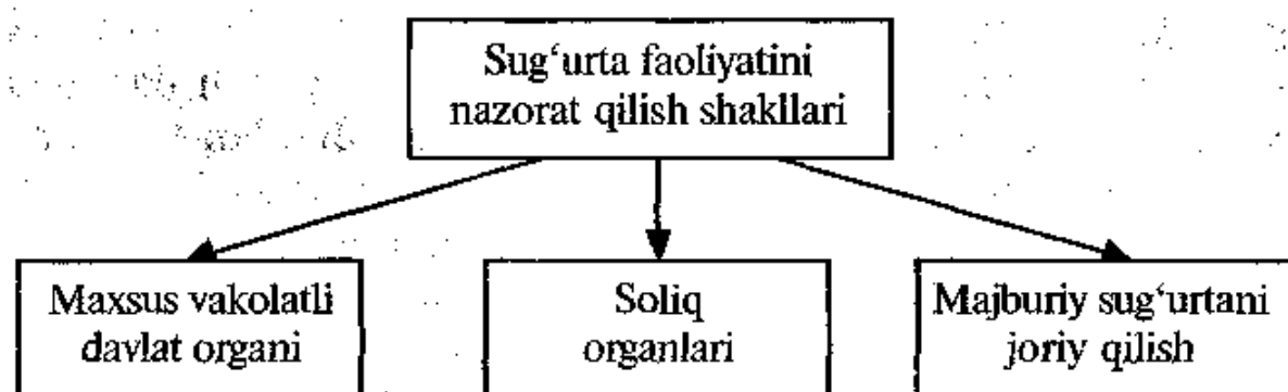
1-chizma. Sug'urta faoliyatini nazorat qilish shakllari.

Masalan, Buyuk Britaniyada sug'urta ishini Savdo va sanoat departamenti, Yaponiyada Moliya vazirligining sug'urta bo'limi, AQSHda esa maxsus sug'urta komissariatlari nazorat qilib boradi. Davlat, bunday nazorat ishini olib borar ekan, avvalo, mam-