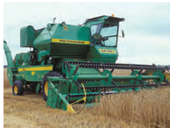
Комбайн убирает зерно.