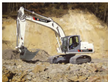
Экскаватор выкапывает яму.

Упражнение 128. Охарактеризуйте людей по их действиям.