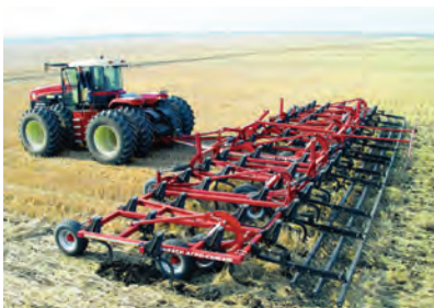
Трактор пашет землю.