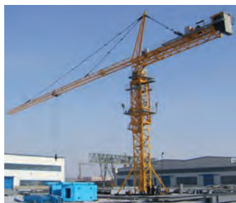
Подъёмный кран переносит грузы.