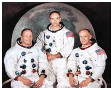
Нил Армстронг, Майкл Коллинз, Эдвин Олдрин

Первый в истории человечества полёт в космос совершил Юрий Алексеевич Гагарин. Это произошло двенадцатого апреля тысяча девятьсот шестьдесят первого года. Полёт Гагарина продолжался всего 108 минут. Но он имел огромное историческое значение: было доказано, что человек может жить и работать в космосе.