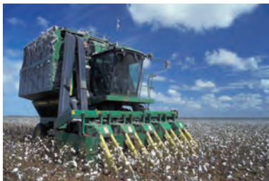
Машина собирает хлопок.

Упражнение 127. Охарактеризуйте эти машины по тем действиям, которые они совершают.