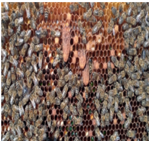
13-расм. Асалариларнинг кўч чиқишга тайёргарлиги