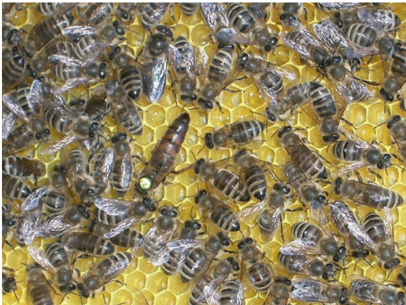
4-расм. “Карпат” асалариси – Apis mellifera carpatuca

Кулранг, хартумчаси ўртача узунликда 6,3-7 мм, етилган она асаларининг ўртача оғирлиги 205 мг атрофида бўлиб, бир кунда 1800 тагача тухум қўйиши мумкин. Асалариларнинг “Карпат” зоти бир қанча ижобий сифатлари билан фарқланади: тинчликсевар, самарадор, қишлаши (“Ўрта рус” зотидан кейин) яхши, кам кўч ажратади, асални рамкаларга жойлаши «курук», ёқимли ва оқ рангда бўлади.