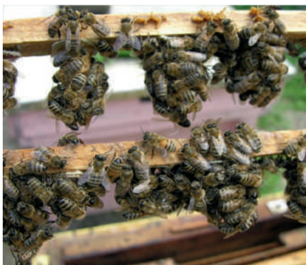
24-расм. Сунъий усулда она асалари етиштириш жараёни

Она асалари етиштириладиган хўжаликларда сифатли уруғланган она асалариларни олиш учун кўпинча тўрт ўринли микронуклеуслардан фойдаланилади. Ҳар бир оиланинг учиб чиқиш жойи (туйнуги) ҳар бир томонга биттадан тўғри келади ва улар ҳар хил рангларга бўялади. Ҳар бир микронуклеуснинг бўлимида стандарт рамканинг тўртдан бир қисмига тўғри келадиган 2-3 та рамкачалар бўлади. Бу усулда уруғланган она асалариларни олиш учун 100-150 г асалари керак. Бу усулни қўллашдаги асосий камчилик шуки, уруғланган она асалариларни тор жойда, узоқ ушлаб туришга тўғри келади.