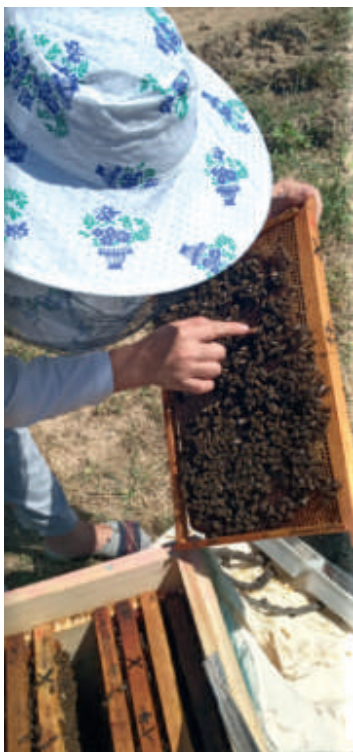
18- расм. Асалари оиласида насли рамкаларни кўздан кечириш

Ёш насли ва асалариларни сақлаш. Бу усулни эртароқ, уяда она асалари чиқариш учун мўлжалланган онадон асоси бўлган мумкосачаларни пайдо бўлишидан аввал қўллаш керак. Агар оилада кўч чиқиш учун онадон қўйилган бўлса, асалариларни ва наслларни саралаш кўч чиқиши олдини олмайди