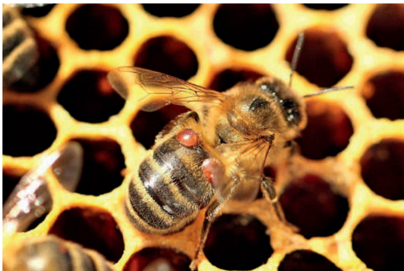
15-расм. Асалари оиласининг варроа канаси билан зарарланганлиги

Қишлоғга кираётган асалари оилаларида варроатоз, акарапидоз, ҳар хил кана ва битларга қарши “Байварол”, “Флюцин”, “Бипин-т” каби дорилардан уч маротабагача қўллаш ҳамда кемирувчи зараркунандаларга қарши тадбирларни амалга ошириш лозим.