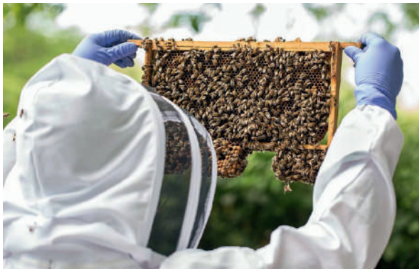
10-расм. Асалари оиласи билан ишлаш

Асаларичи асалари оиласи билан ишлаш учун олдиндан тайёргарлик кўриш лозим. Асаларичи қиш мавсумида асалари учун керакли бўладиган барча жиҳозларни, янги рамка, мумпарда, асалари қутиси ва бошқа иш қуролларини тайёрлаб қўйиши лозим. Акс ҳолда баҳорда асалари оиласига қаров ўтказиш даврида, қилинадиган ишларни бажаришга вақт топмаслигингиз мумкин.