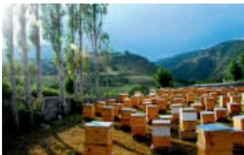
9-расм. Асалари оиласини жойлаштириш

Ҳар бир асалари оиласининг ҳолати текширилиб, унинг кучи (рамкаларини асалари билан тўлиқ қопланганлиги), она асаларининг борлиги, рамкалардаги очик ва ёпиқ насларнинг сони, уядаги озуқа асал миқдори, асалари уяси ҳолати (уянинг қуруқлиги, ифлосланганлиги, ўлик асаларилар миқдори) каби кўрсаткичлар ҳи-