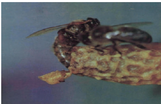
22-расм. Сунъий усулда она асалари етиштириш

Агар, тарбияловчи оилада етиштирилиши керак бўлган насл сони керакли миқдорда бўлмаса, бошқа оилалардан насли рамкалар олиниб, аввалдан уларга бир хилдаги ҳид берилиб, олти соатдан кам бўлмаган муддатда она асаларисиз ҳолда ушлаб турилади, сўнгра уларни қўшиш мумкин.