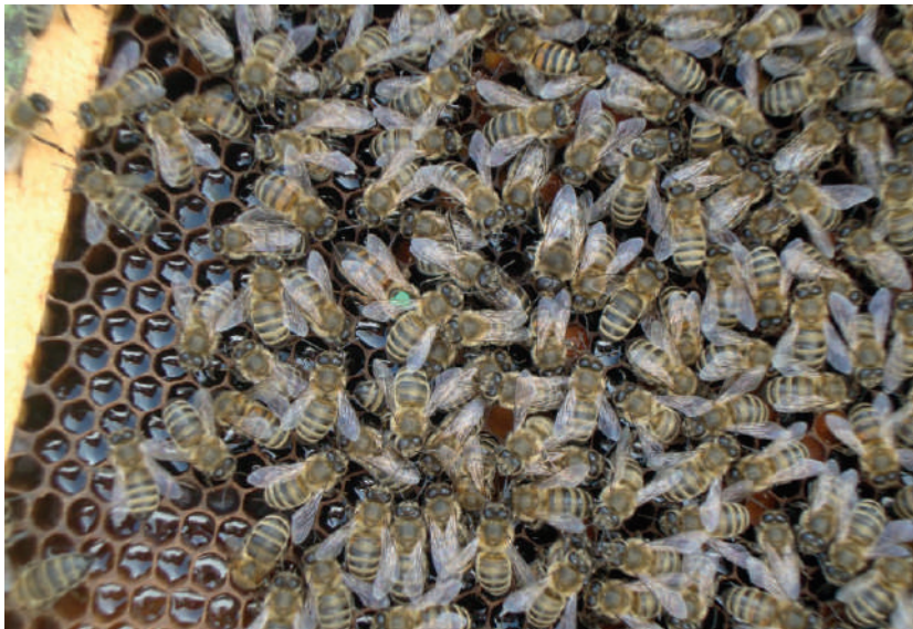
3-расм. “Кавказ тоғ кулранг” зоти – Apis mellifera caucasicus

тарбиялашда иштирок этаётганлари ҳам) далага, гулшира йиғишга сафарбар этилади.