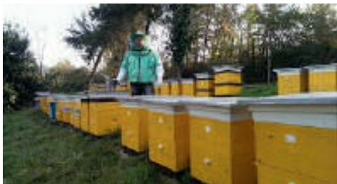
8-расм. Асалариларга жой танлаш

Танланган майдончаларда асалари оилаларини жойлаштиришга алоҳида эътибор бериш лозим. Улар биртекисда, шахмат усулида қаторлаб қўйилиши керак ва уядаги қўйилган рақамлар очик кўриниши лозим. Асалари қутилари қуёш тифидан ҳимояланиши ҳамда асалариларни мўлжал олиб учишига ёрдам берувчи дарахтлар, иншоотлар бўлиши керак.