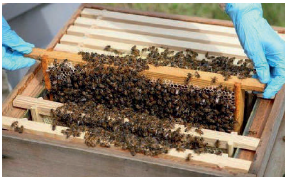
11-расм. Асалари оиласини баҳолаш жараёни

чига илмий-амалий қўлланмалар, тавсияномалар ва бошқа меъёрий-техник ҳужжатлар яқиндан кўмақдош бўлади.