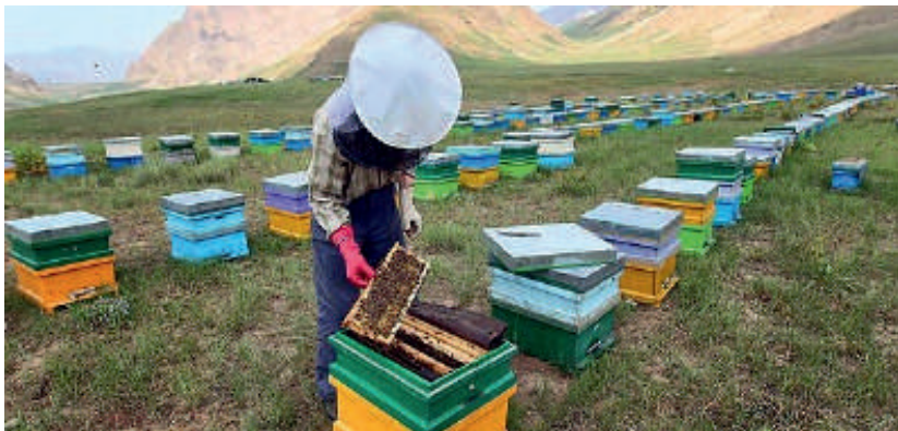
12-расм. Асалари оиласида баҳорги назорат ишлари

Асалари юксиз ҳолатда соатига 65 км тезлик билан учади, яъни тезюрар поезд билан мусобақалашишга қодир. Асаларилар гул ширасини йиғиб олган бўлса, учиш тезлиги соатига 18–30 км га пасаяди (шамолнинг кучи ва йўналишига боғлиқ ҳолда). Парвоз пайтида асалари бир сонияда 440 марта қанот қоқади.