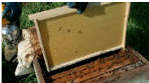
25-расм. Оилаларга янги мумпарда рамкалар бериш

Янги мумпардали рамкаларни тўқитишда бир қанча омилларга, яъни уяда ёш асалариларнинг етарли бўлишига, уларнинг физиологик ҳолатига, мум ажратиш хусусиятларига эътибор бериш лозим. Даладан гулшира ва гулчанг келмаётган даврда эса ҳар қандай озуқа миқдори бўлса ҳамки, асалари оиласи янги мумпардали рамкаларни тўқимайди.