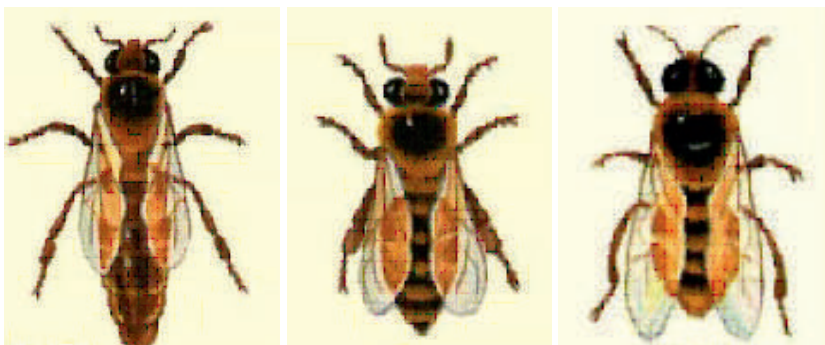
А - Она асалари

Асалариларнинг нормал оиласи битта она асалари, 50-80 минг (асалари оиласининг катта- кичиклигига кўра) ишчи асалари, юзларча эркак асаларилардан ташкил топади. Шу билан бир вақтда, оилада тухум, асалари личинкалари ва ғумбаклари ҳам бўлади.