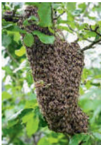
14-расм. Кўч чиқиш жараёни

Асаларилар кўчининг оғирлиги 7–8 кг бўлиши мумкин, унда