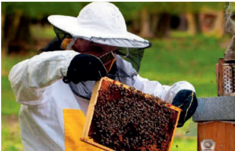
19- расм. Асалари оиласида ёш насли борлигини аниқлаш

уяларда (кўп қаватли, ётиқ уялар) парваришлаганда жуда кўл келади, бунда оиладан олинган ортиқча асаларилар ва насли рамкалар янги оилаларни шакллантириш учун ишлатилади.