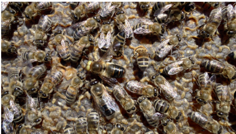
2-расм. “Ўрта рус” асалариси – Апис меллифера меллифера .

“Ўрта рус” асалари зоти. Бу асалари Марказий Европадан келиб чиққан. Эволюцияси нисбатан Россиянинг совуқ иқлим шароитида ўтган, шу туфайли бу зотлар шимолий ўлкалардаги ўрмон шароитига мослашган, совуққа қарши тура оладиган бўлиши билан фарқ қилади. Бу зот белгиларига кўра, табиий танланиш йўли билан пайдо бўлган.