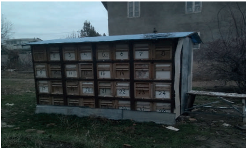
28-расм. Асаларичиликда ишлатиладиган тортма уялар

Кўчма павильондаги ишчи асаларилар бир уядан иккинчи уяга адашиб кирмасликлари учун, асалари кутилари ҳар хил рангларга бўялади ва уларга махсус рақамлар қўйилади. Павильон ички қисмига (об-ҳаво инжиқлиги, кўёш жазирамаси) ташқи таъсирлар сезилмайди, унинг кенглиги – биринчи қатордан иккинчи қаторгача бўлган масофа 1,5 метрни ташкил этади. Унинг устки қисми махсус юпқа баннер материали билан ёпилади. Баннер остидан иссиқ ва совуқ ҳавони ўтказмайди синтефон материали қўйилади.