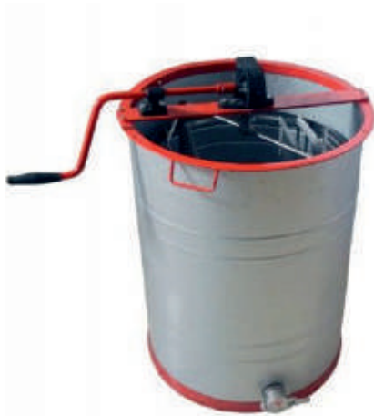
27-расм. Асал тортигич.

Асал тортиш даврида пичоқ доимо иссиқ сув ичида туриши лозим. Бунинг учун олинган асалли рамка махсус идиш устига қўйилади. Рамканинг ён томонидаги планкасини столга таянтирилган ҳолда, иситилган пичоқни қуйидан юқорига қараб ҳаракатлантириб, асал устидаги мум қопқоқчаларни кесиб олинг. Кесилган мум қопқоқчаларини стол остидаги темир тўрли идишга солиб қўйинг, ундан ҳали кўп тоза асал оқиб тушади.