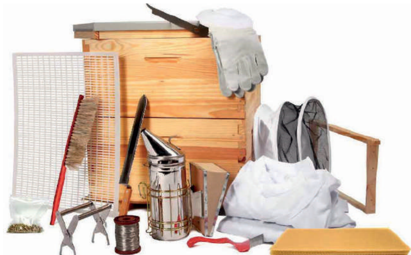
7-расм. Асаларичиликда ишлатиладиган жиҳозлар

лиги 18-20 см, эни 3-3,5 см ва қалинлиги 0,3 см ни ташкил этади.